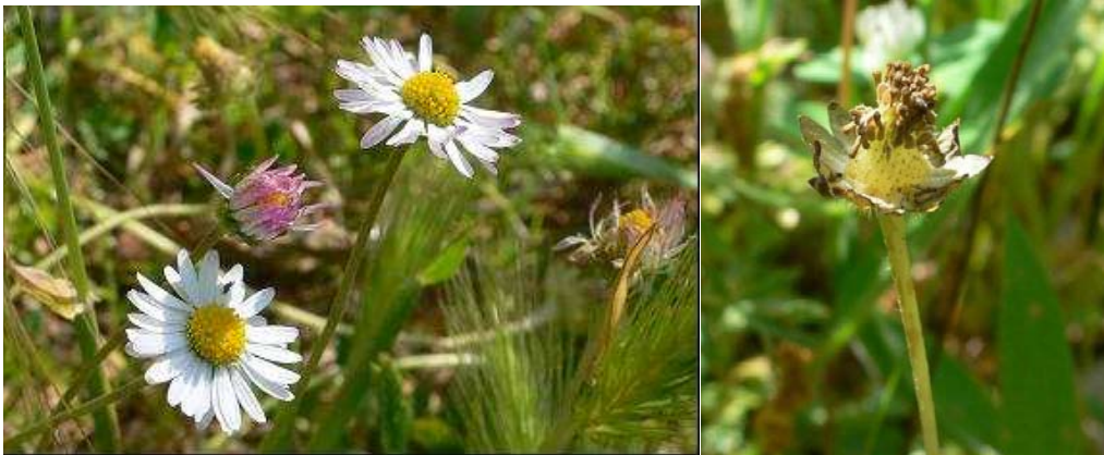
Figura 2 – B. perennis da acession de Marvão (à esquerda) e cipselas no receptáculo cónico da acession de Cabeza de la Vaca (à direita).

A utilização ornamental das Bellis spp. é diversificada, podem ser colocadas em vasos, floreiras ou canteiros de espaços verdes privados ou públicos. Existem variedades com diferentes cores de pétalas (rosa, branca, vermelha ou roxa), assim como variedades de pétalas simples ou dobrada.