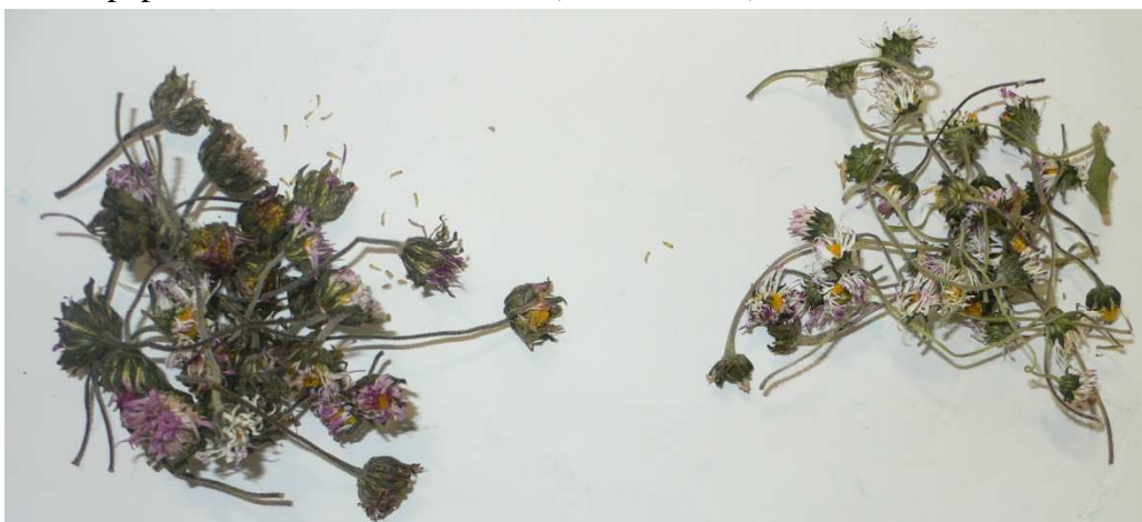
Figura 1 – Amostra de B. sylvestris (esquerda) e de B. perennis (direita).

As folhas da B. sylvestris são verde escuras (30-180x5-25 mm), trinérvias, oblongas a oblongo-obovadas, remotamente serradas a sub-inteiras; o pecíolo é curto e pouco distinto. O pedúnculo (10-45 cm) das inflorescências é robusto e não é aclavado junto ao capítulo. Os capítulos (20-40 mm de diâmetro) têm um receptáculo cónico a hemisférico. As flores liguladas têm 8-14mm. Os frutos são cipselas pubescentes, por vezes com pilosidade de escamas setiformes (Franco, 1984).