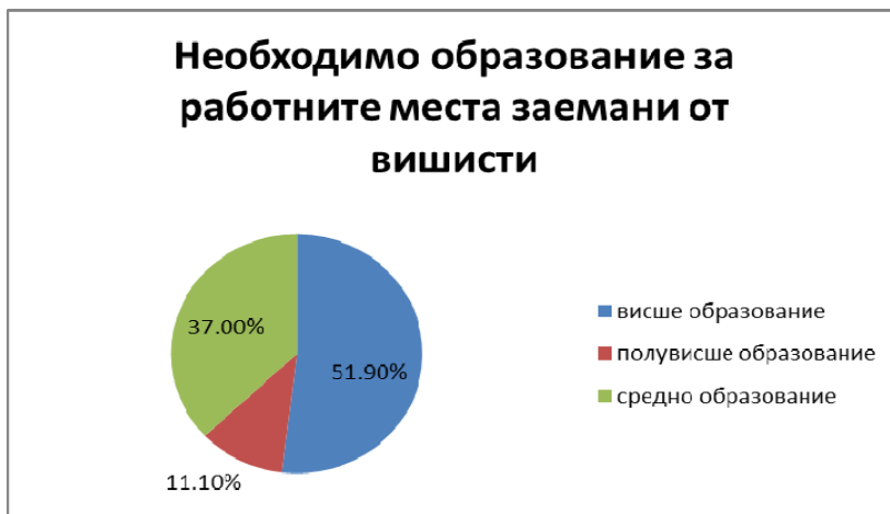
Фигура 2. Около половината работни места в САЩ заемани от висшисти не изискват висше образование [17].

Преди 30 години в България беше популярен съвета “Учи за да не работиш!” Имаше се предвид да не се работи физическа работа, но в момента сме свидетели, че висшето образование не е вече гаранция не само за хубава работа, но за работа изобщо. В САЩ безработицата сред висшистите под 25 години е 11.2% [17]. Този процент изглежда добре в сравнение с Италия, Испания и Португалия, където безработицата в тази група е 25% [18]. Голяма е и скритата безработица, при която висшистите работят нискоквалифицирана работа, неизискваща висше образование – в САЩ тя е над 48%. (Фиг. 2) Според [5], 18 000 пазача на паркинг, 317 000 келнера, 365 000 касиера и 24.5% от продавачите в Америка имат висше образование.