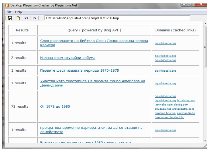
Фигура 1. Отчет, генериран след използването на Desktop Plagiarism Checker, показващ оригиналността на документа и местата, от които е взет

Plagiarisma.Net – онлайн средство за проверка за плагиатство за над 190 езика, включително и на български, което може да бъде инсталирано и като десктоп приложение. [7] На фигурата е показан отчет от проверката на текстов файл, чийто текст е изцяло копиран от Wikipedia.