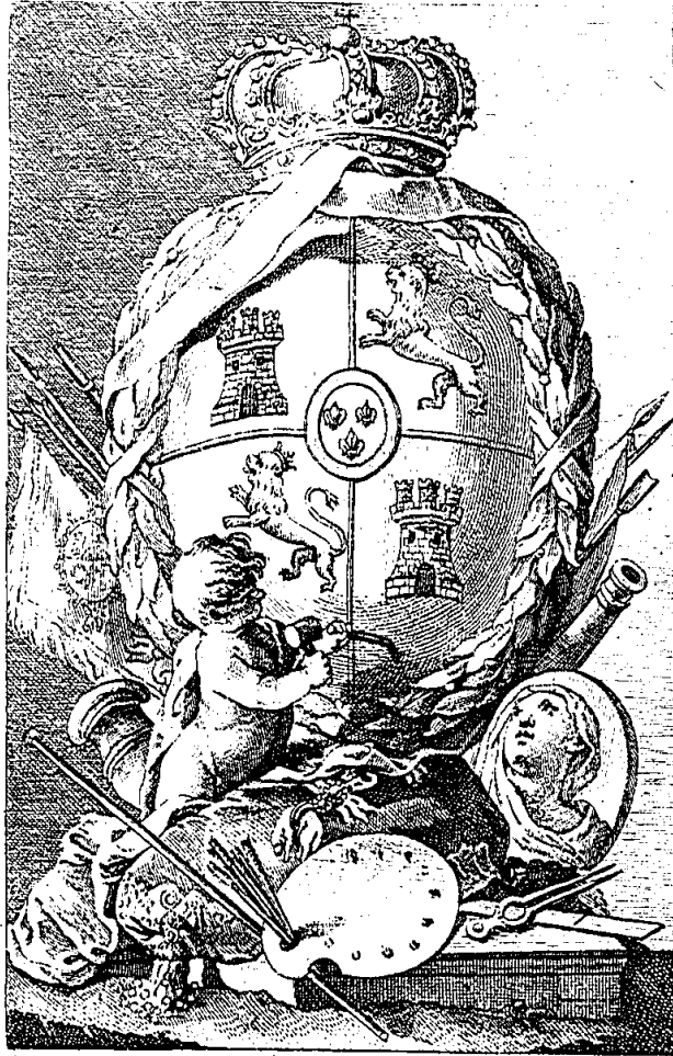
Emmanuel's Kunst auf'sicht.

MANUEL BAS CARBONELL No. 11.002 BIBLIOTECA