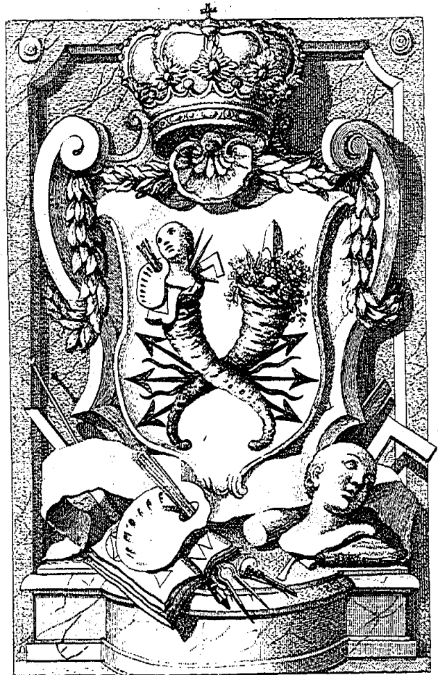
Emmanuel Konfort sculpt.