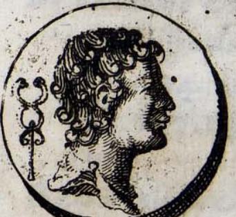
16 B. D