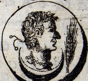
14 B. E