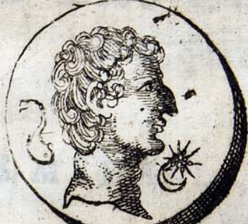
13 B. E