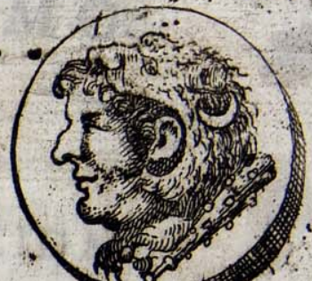
15 B. C