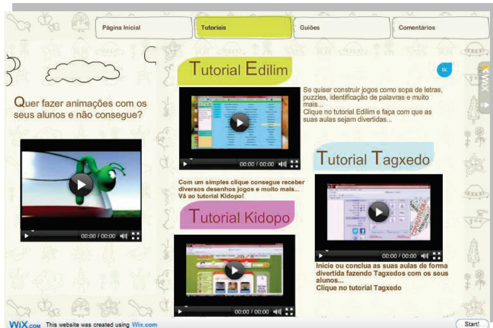
Figura 2 – Página dos tutoriais