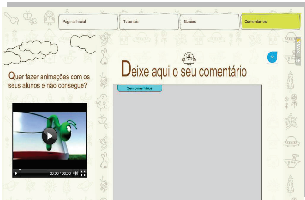
Figura 4 – Página de comentários