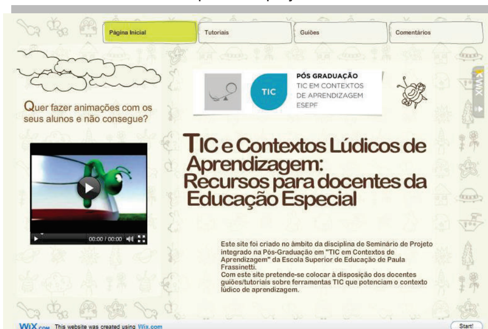
Figura 1 – Página inicial do site