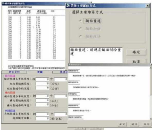
圖 2 ICSMART 程式之輸出圖例

ICSMART 程式僅需利用鋪面個案的基本設計資料與破壞調查資料，即可針對可能有問題的鋪面個案路段進行鋪面破壞的現況評估，並將結果依各種不同的破壞型態加以彙整，進而推斷出鋪面的破壞成因。此外，本程式在輸入調查所得的鋪面相關資料後，可由系統內的預估模式預測未來的鋪面狀況，並以圖形化的表示方式加以輔助，如圖 3 所示，為鋪面績效之預測圖。