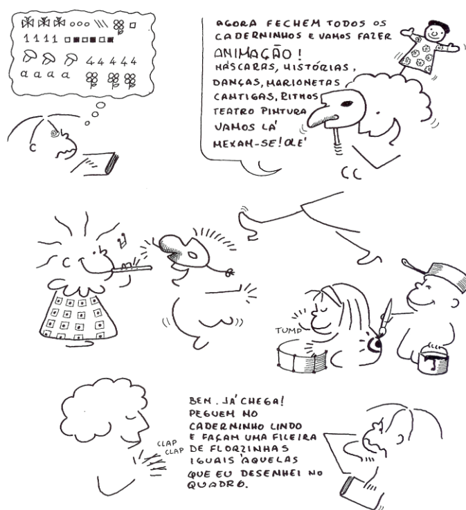
Figura 2 - Abordagem da Expressão Dramática na sala de aula, (Tonucci, 1988, p. 87)

Em alguns casos, esta lógica dita a pluridocência na Educação Pré-Escolar e reforça as estruturas estereotipadas da cultura escolar, como a definição de objectivos, estratégias, programas, e mecanismos formais de avaliação.