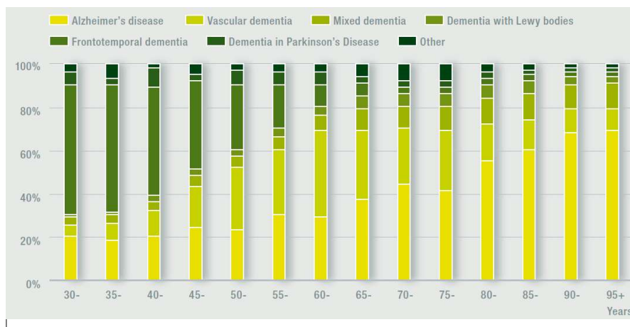
Gráfico 2 -Estimativas de consenso da proporção de todos os casos de demência por subtipos de demência, idade e sexo (homens), OMS (2012).

A demência, síndrome que pode ter várias etiologias e englobar várias doenças que, e de acordo com a definição de Sequeira (2010), surge na sequência de uma doença cerebral, de natureza crônica, progressiva e com perturbação de múltiplas funções corticais leva inevitavelmente a uma deterioração progressiva na memória e nas atividades de vida diárias, afetando ainda o humor e a personalidade da pessoa.