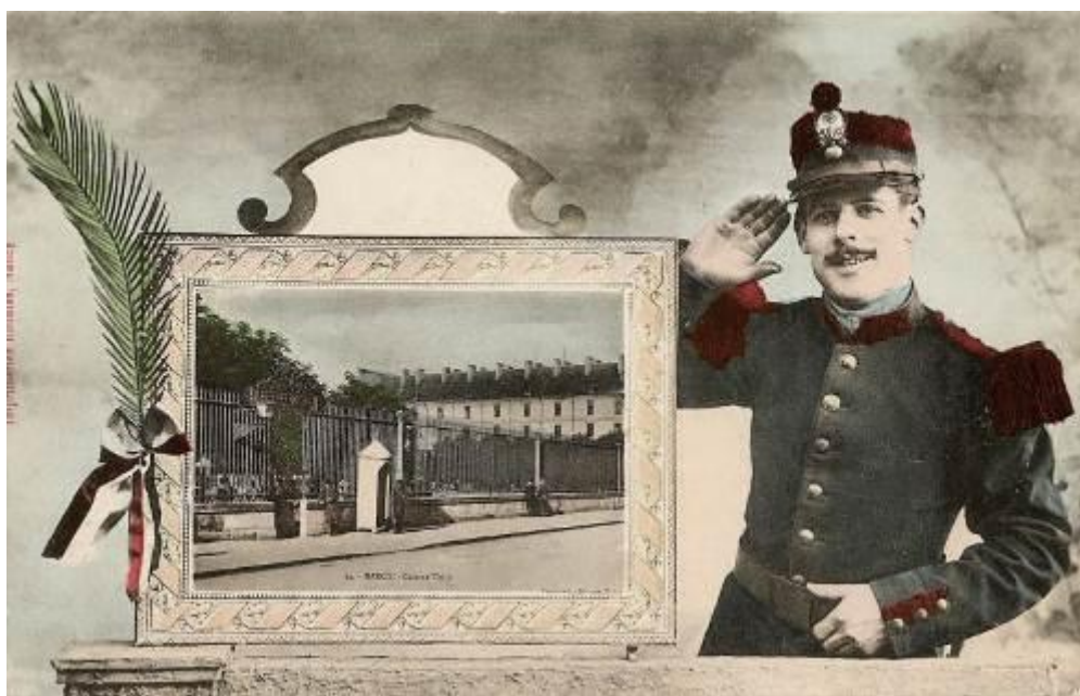
Imagen 8. Militar retratado junto a la Caserna Thiry.