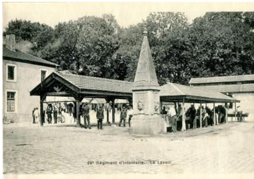
Imagen 5. Fuente y lavadero de la Caserna Thiry.