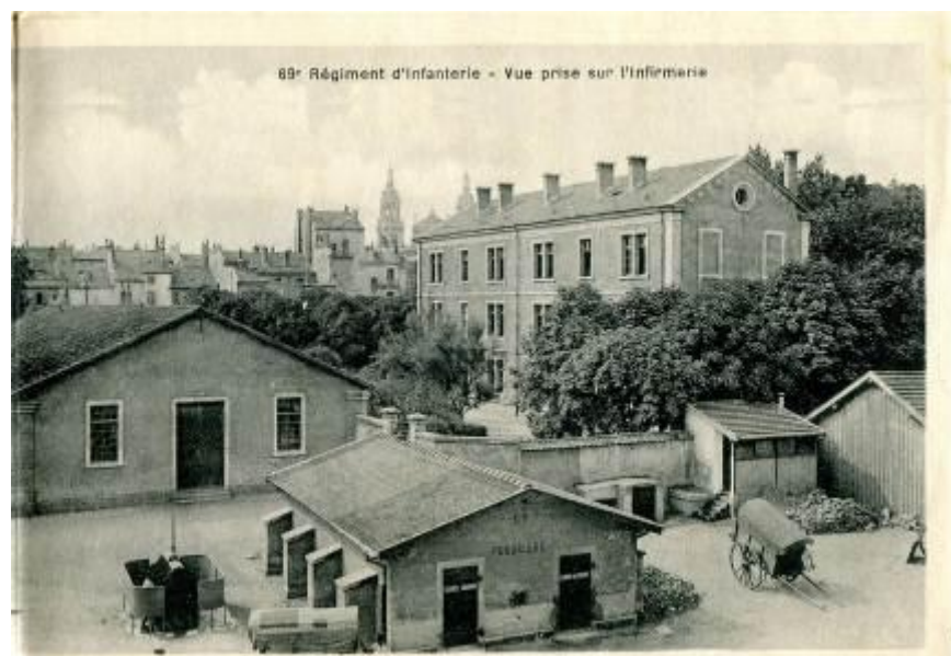
Imagen 6. A la izquierda, los urinarios de la caserna Thiry, en el centro, la enfermería.