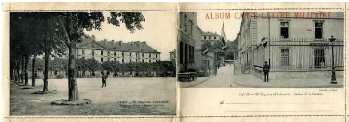
Imagen 3. La caserna principal vista desde el patio y entrada lateral. Postal que, al estar unida a la imagen de la caserna Thiry que ya reconocíamos y, al estar escrito que albergaba al regimiento 69, nos permitió identificar más estancias de este espacio de cautiverio.