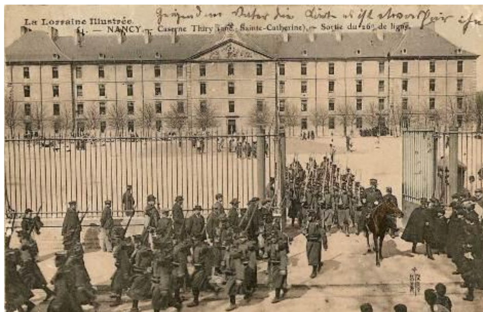
Imagen 4. Detalle del cuerpo frontal con militares. Única postal donde se registran los dos nombres de la Caserna.