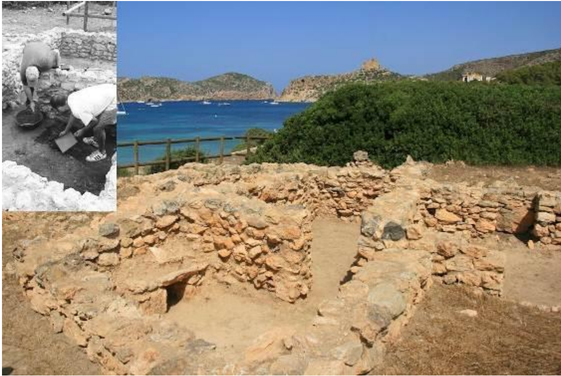
Imagen 1. Barracas de los prisioneros de época napoleónica. Isla de Cabrera, Mallorca. Collage preparado por María Zozaya con fotografía de las excavaciones.