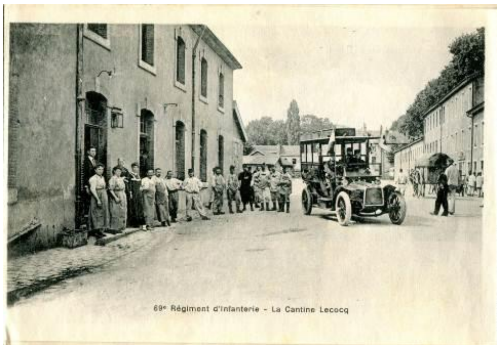
Imagen 7. Cantina de la caserna, denominada “Le cocq”.