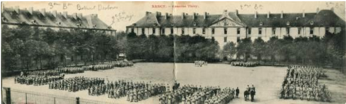
Imagen 2. Caserna Thiry (Nancy, Francia). Caserna principal y lateral con militares formando en el patio.