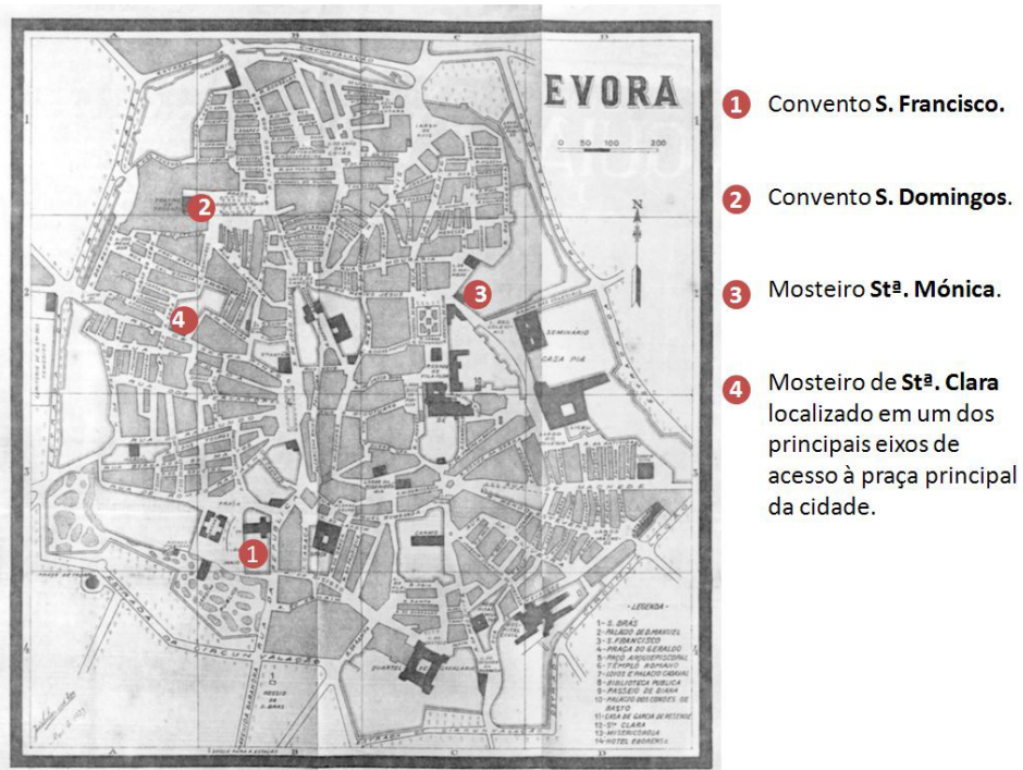
Fig. 13. Praça da cidade amuralhada (planta base: C.M.E.).