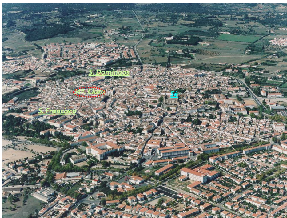
Fig. 14. Vista aérea da cidade (foto base: 1997, C.M.E.).