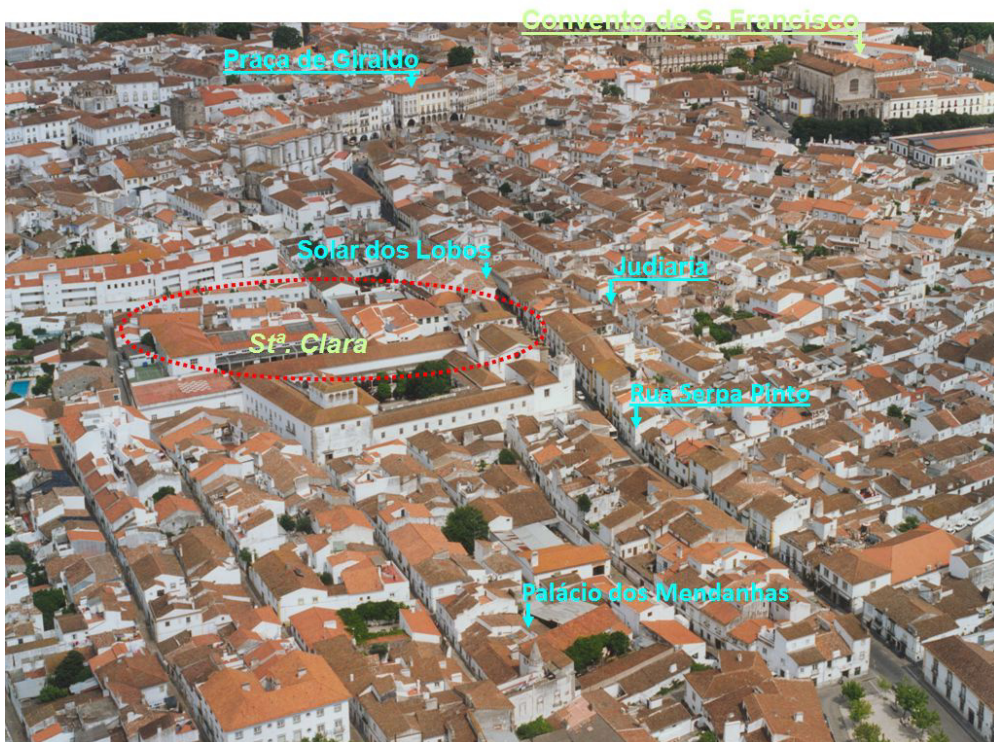
Fig. 9. Rua Serpa Pinto.