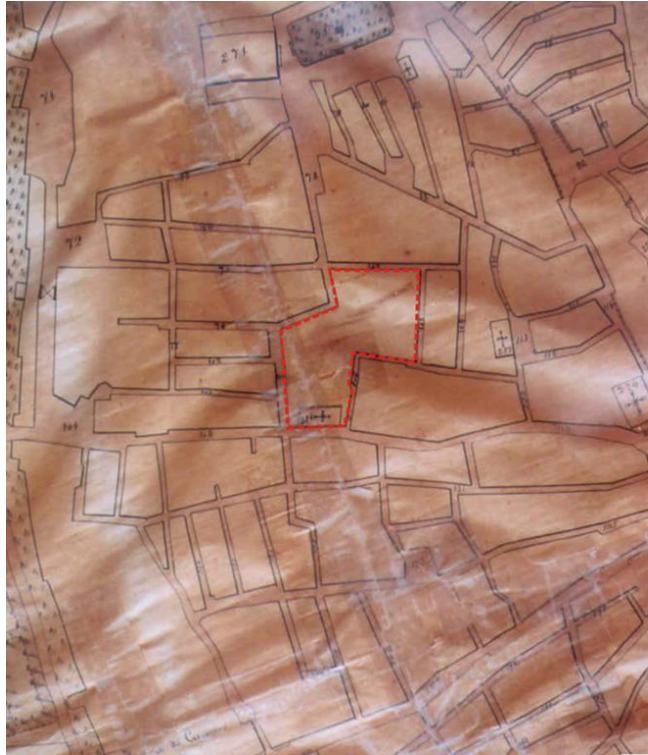
Fig. 11. Extracto de planta datada de Fevereiro de 1884 com reconstituição da área monástica e envolvente de Santa Clara (planta base: avulsa; M.E.).