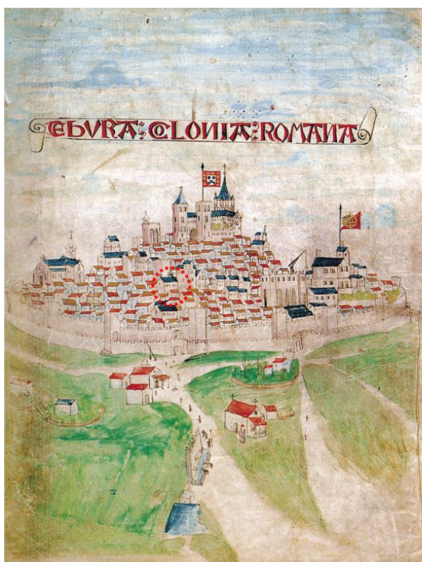
Fig. 2. Vista poente da cidade. Iluminura do segundo foral desta cidade datado de 1505 (doc.: C.M.E.).