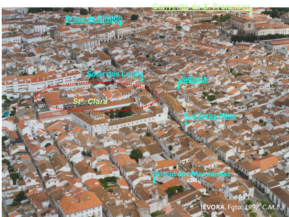
Fig. 8. Rua Serpa Pinto.