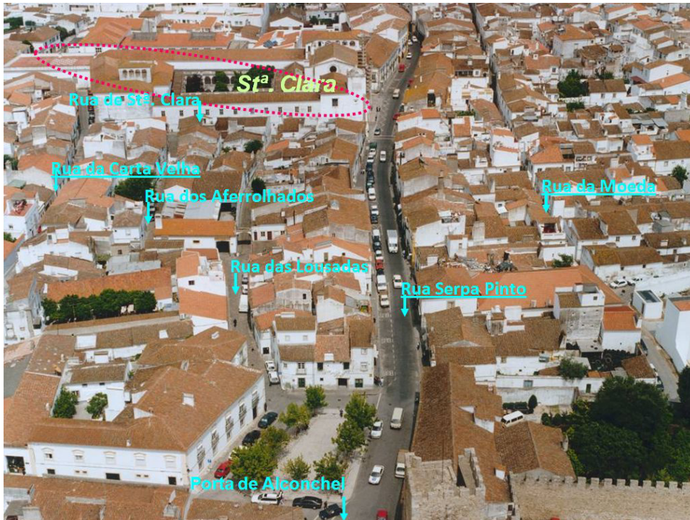
Fig. 7. Rua Serpa Pinto.