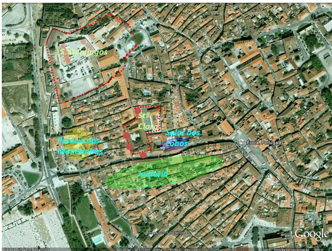
Fig. 4. Mosteiro de Santa Clara e área envolvente (doc.base: mapa Google; 2010).