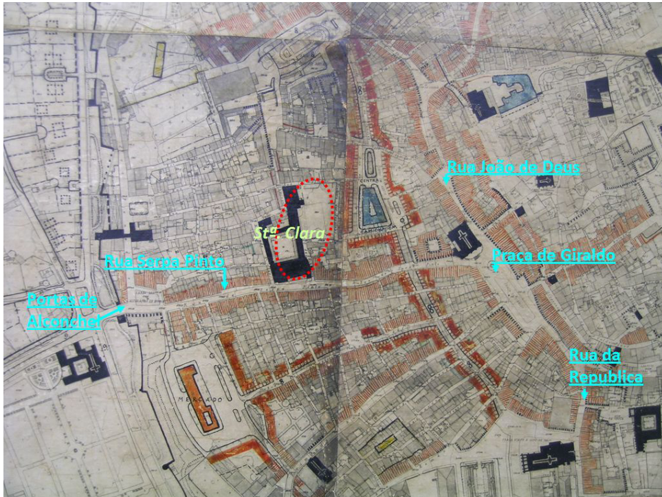
Fig. 12. Extracto do Ante projecto do Plano de Urbanização de Évora (planta base: 1945; C.M.E.).