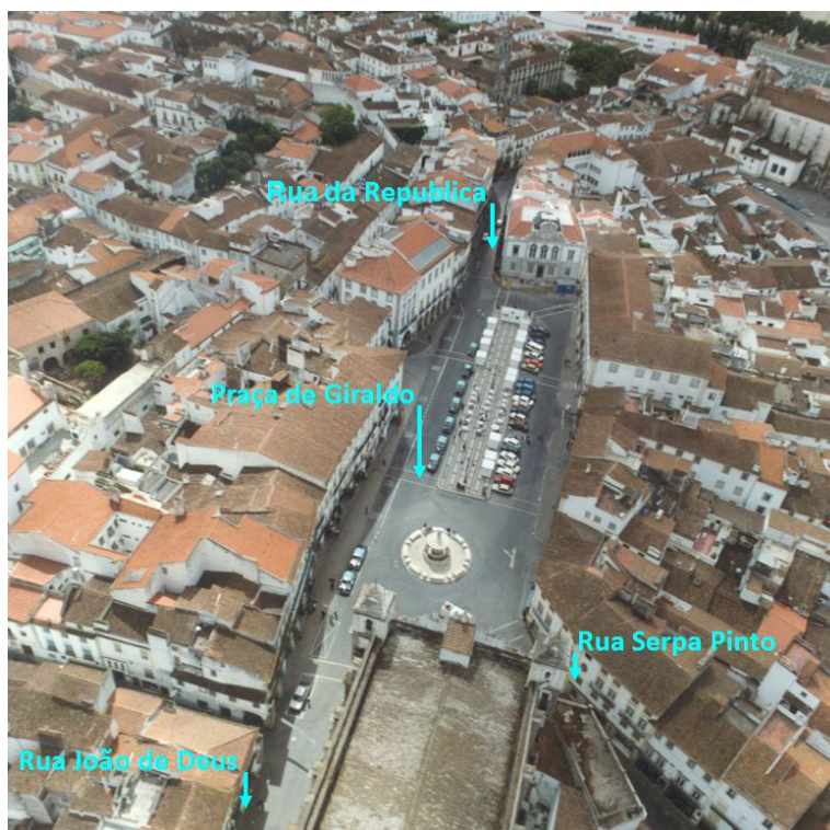
Fig. 6. Praça de Giraldo (foto base: 1997; C.M.E.).