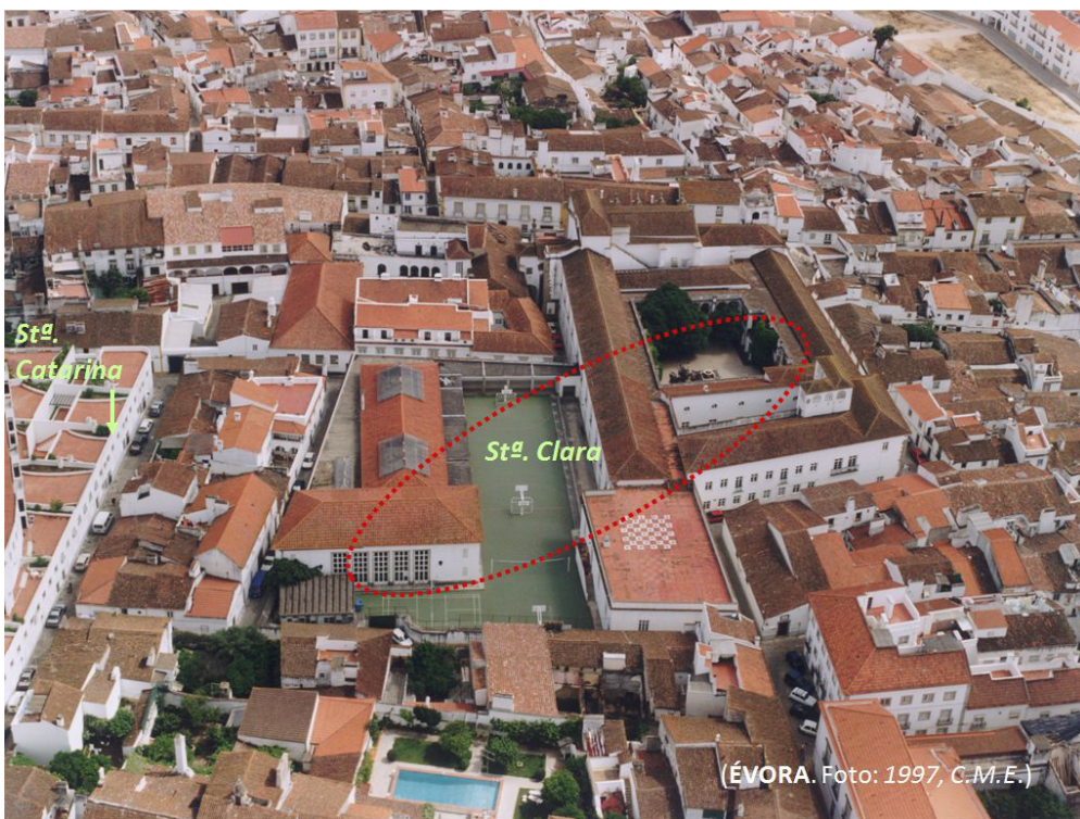
Fig. 10. Antigo Mosteiro de Santa Clara.