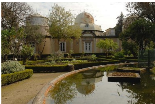
Observatório Astronómico da Escola Politécnica (1898), implantado no meio do Jardim Botânico

Assim, desde a origem do Museu, a concepção e realização de espaços destinados ao conveniente acondicionamento destes testemunhos, bem como as iniciativas necessárias à sua recolha – nem sempre coroadas de êxito... - e inventariação. Esta recolha já permitiu recuperar para o património histórico-científico nacional alguns milhares de peças de equipamento. Entre elas citemos um raríssimo círculo de proporção do século XVII, um octante da oficina de George Adams, do século XVIII, duas lunetas astronómicas , ambas