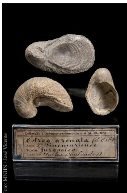
Exemplares da Colecção D'Orbigny, oferecida em 1855 pelo paleontólogo francês Alcide d'Orbigny a D. Pedro V

É claro que um empreendimento desta dimensão não pode deixar de agradar, e muito, à autarquia, carente que está de fundos. Do mesmo modo, receio que também esteja a ser visto pela Universidade como uma promessa de financiamento para fazer face às suas múltiplas carências. Sei, pelo que ali se fez e pelo que ali existe de capacidade para fazer, todo o espaço do grande edifício não seria de mais para albergar um Museu de Ciência pleno de vitalidade e um Museu de História Natural digno de um país que abriu o mundo à Europa dos séculos XV e XVI, uma instituição com século e meio de investigação e ensino que, não obstante a exiguidade orçamental de sempre, ultrapassou dificuldades e conquistou um lugar de merecido destaque no panorama nacional.