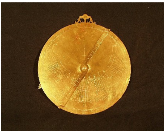
Círculo de proporções, atribuído a Elias Allen, Londres, c. 1630 (MCUL501)

Os imóveis principais da antiga Escola Politécnica estão hoje ocupados por dois museus científicos da Universidade de Lisboa, o mais recente dos quais é o Museu de Ciência, oficialmente criado pelo Decreto-Lei nº 146/85, de 8 de Maio, mas cuja génese se encontrava em reflexões e trabalhos iniciados quase vinte anos antes. Ele foi concebido como um espaço de cultura científica, desde a sensibilização para o conhecimento dos princípios fundamentais das ciências (ditas) exactas e suas aplicações, até à divulgação da história da experimentação científica, traduzida na exibição dos testemunhos que chegaram até nós dos equipamentos que desde o século XVII têm sido usados na criação, aplicação e ensino da Ciência.