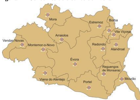
Figura 1 – Concelhos do distrito de Évora