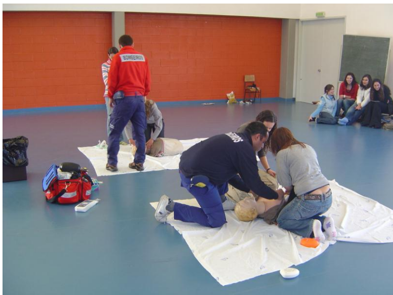
Figura 2. Sessão promovida pelos bombeiros, na sala de ginástica da escola, dedicada ao SBV.