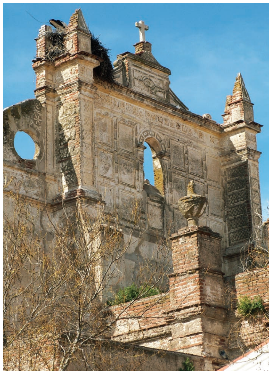
Fig. 4 - Igreja Matriz de Safara, Moura

neste caso, entre o plano de fundo e o de superfície é muito reduzida. Este facto permite-nos levantar a hipótese de que este contorno escuro seja uma opção técnica e estilística, análoga aos exemplos observados em Mondovì, Piemonte, representativos das descrições de Vasari (fig. 1).