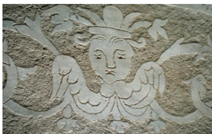
Fig. 5 - Igreja do Espírito Santo, Arronches

Por último gostaríamos de apresentar um invulgar caso de esgrafitos existente em Arronches, na Igreja do Espírito Santo, e que está a ser objecto de uma intervenção de conservação. A decoração esgrafitada, a branco e areia, reveste a totalidade das paredes, com motivos vegetalistas e de grotescos, traduzindo uma clara filiação renascentista com qualidade de execução. A singularidade deste caso deve-se, não só ao facto da decoração esgrafitada ultrapassar o apontamento decorativo e se estender a toda a superfície interior, sendo relativamente fácil de perceber a coerência