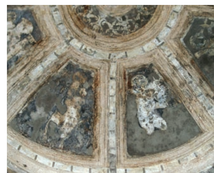
Fig. 3 - Palácio Ducal, Vila Viçosa