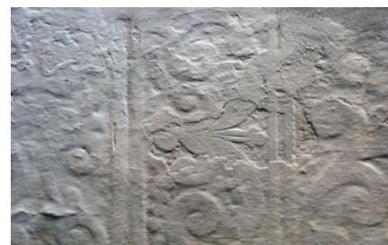
Fig. 6 - Convento de S. Francisco, Almodôvar

Podemos concluir perante os muitos casos inventariados durante a nossa pesquisa, sobre os esgrafitos no Alentejo 5 e durante o estudo realizado sobre os esgrafitos em Évora 6 , alguns dos quais aqui apresentados, que a técnica predominante no Alentejo é a do esgrafito com o fundo cor de areia. Esta argamassa sem adição de pigmento específico ganha contudo inúmeras colorações que vão do amarelo ao acastanhado, passando pelo acinzentado devido às diversas colorações das areias locais utilizadas nas argamassas. Existem, também, no Alentejo, assim como outras regiões, esgrafitos que utilizam a argamassa de fundo de cor cinzenta/negra conseguida através da adição do carvão ou palha queimada à argamassa. Já em menor número surgem os exemplos de esgrafitos cujo fundo é vermelho conseguido através da adição