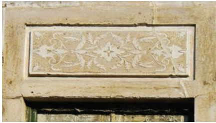
Fig. 7 - Rua 5 de Outubro, Évora - antes