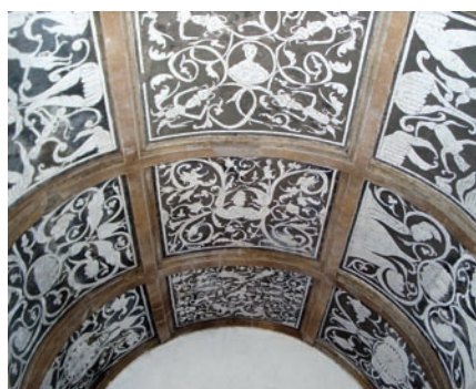
Fig. 2 - Igreja de S. João Baptista, Amieira