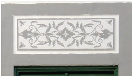
Fig. 8 - Rua 5 de Outubro, Évora - depois

Muitas destas acções de renovação e repintura deturpam e invertem a imagem do esgrafito (ora invertendo a relação cromática entre o fundo e o ornato, ora alterado significativamente as cores da decoração) com consequências na leitura e linguagem do edifício e/ou na imagem urbana. Este tipo de alterações acrílicas, muitas resultantes de intervenções inexperientes e improvisadas, têm, por exemplo, transformado significativamente a imagem da cidade histórica de Évora, progressivamente homogeneizada em cidade branca rematada a amarelo-ocre/cinzeno, desprezando toda a sua riqueza cromática anterior e as ornamentações originais, mais ou menos ecléticas (feitas de uma profusão de ornatos em massas, de esgrafitos e de fingidos) (figs. 7 e 8).