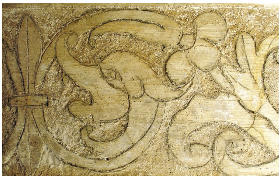
Fig. 1 - Igreja de Nossa Senhora da Assunção, antiga Sé de Elvas

Acreditando na importância da divulgação, gostaríamos, com este artigo, dar a conhecer e sensibilizar o leitor para o valor histórico e artístico deste tipo de revestimentos e, sobretudo, apontar situações de risco que ocorrem neste tipo de património ornamental e arquitectónico, enfatizando a necessidade de salvaguardar a sua autenticidade estética e material, sobretudo quando ocorrem intervenções planeadas de reabilitação urbana e de restauro arquitectónico.