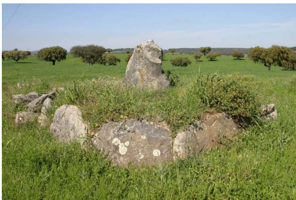
1 – Anta da Rasquilha