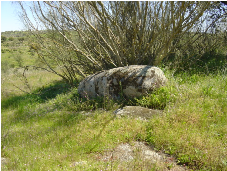
2 – Menir do Reguengo