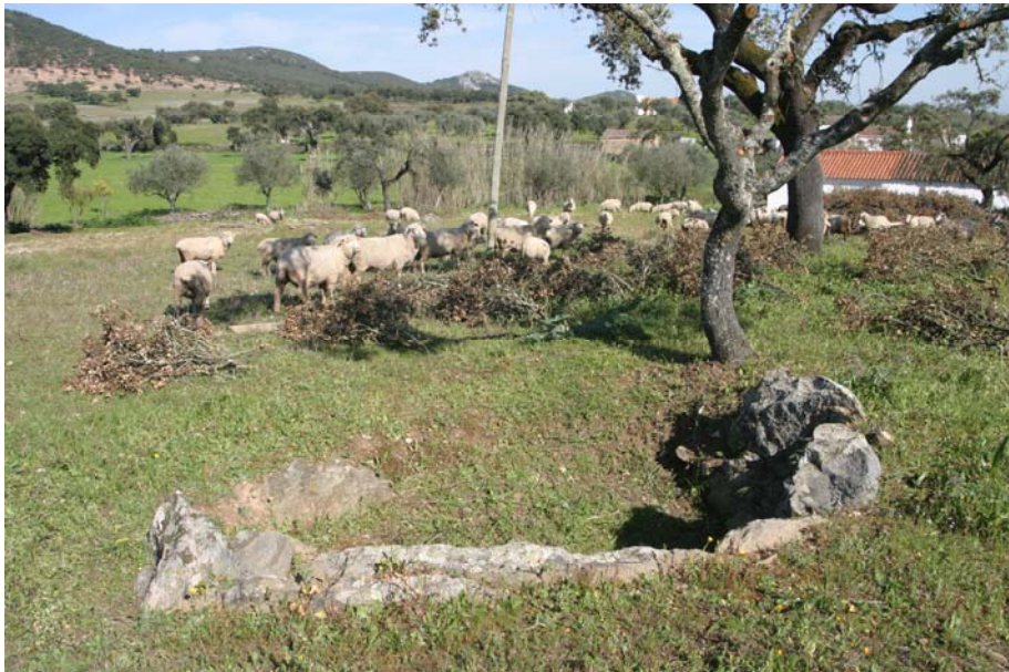
9 – Anta da Nave Fria 1