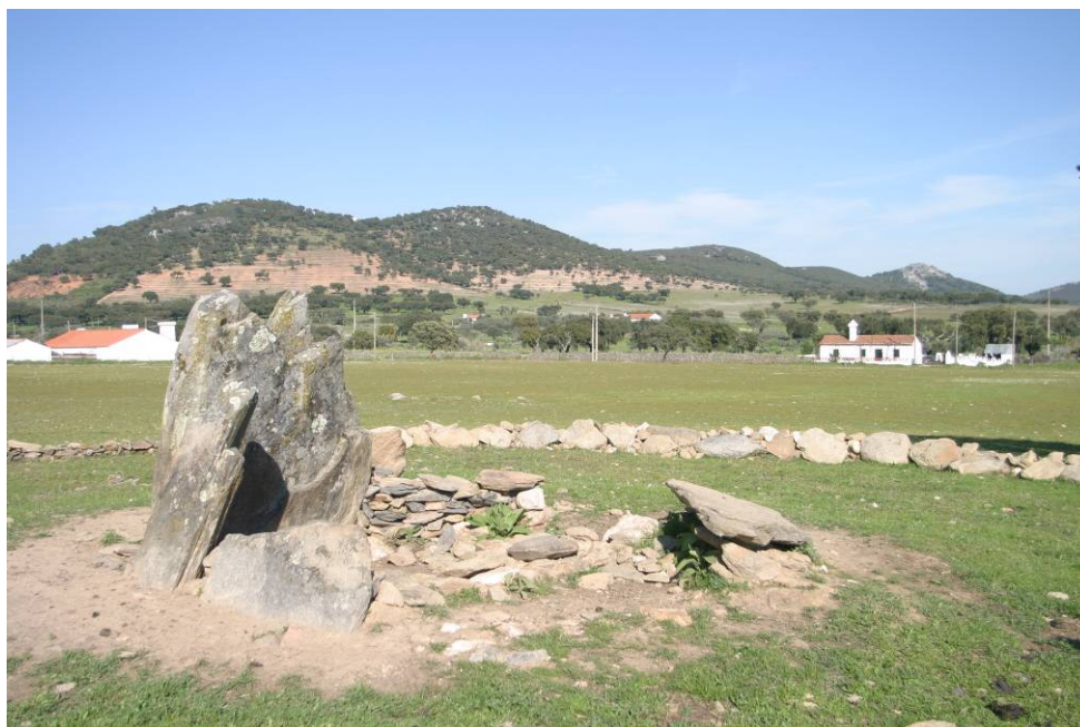
10 – Anta da Nave Fria 2