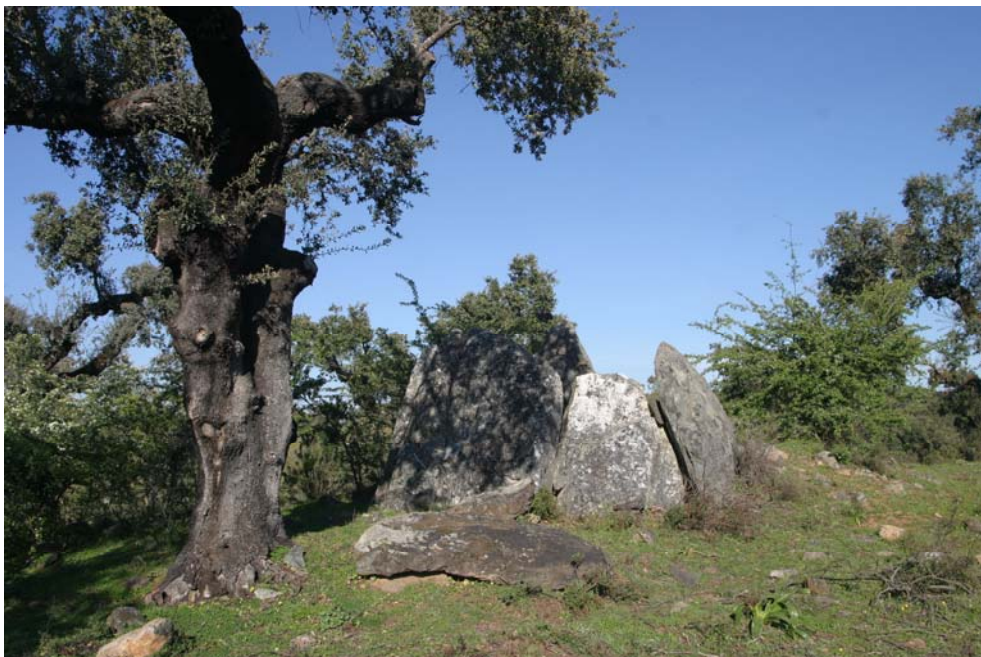
5 – Anta das Sarnadas