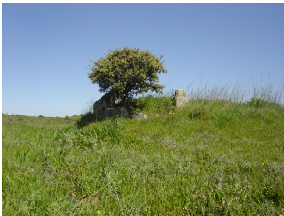
3 – Anta do Reguengo