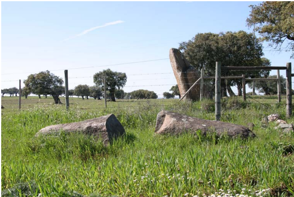
13 – Esteios junto à Anta da Rasquilha