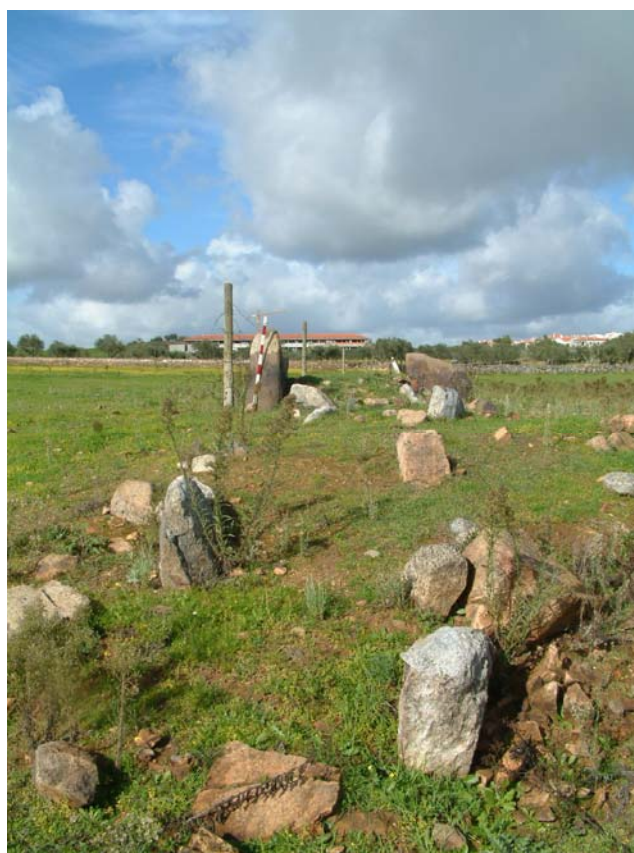
11 – Anta de Santo António