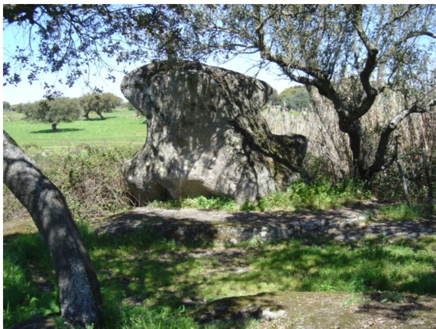
14 – Afloramento trabalhado junto à Anta de Vale de Bêbedas