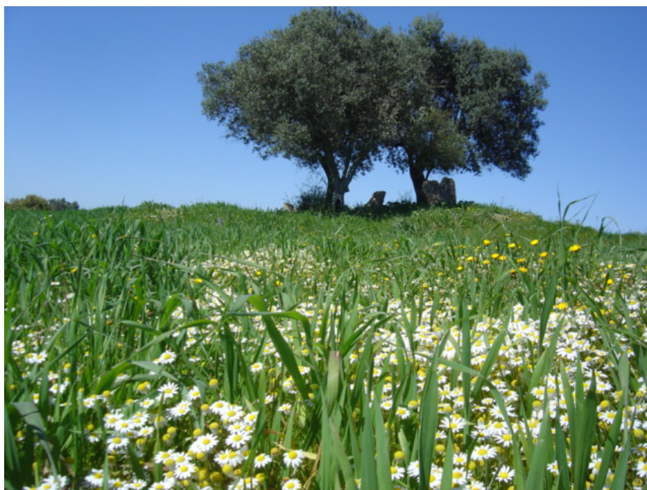
7 – Anta dos Moreiros