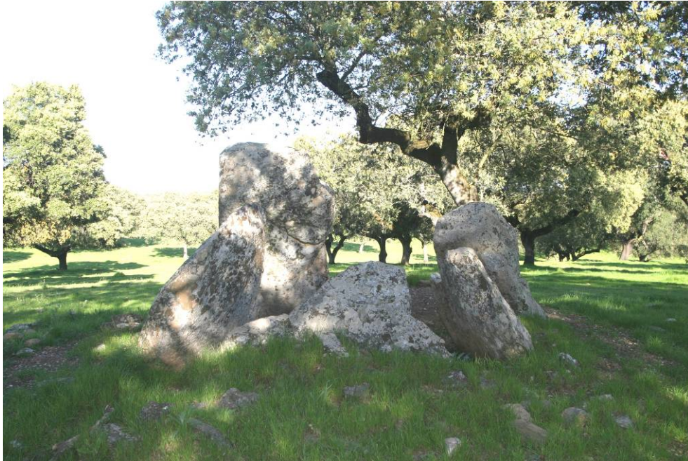
4 – Anta dos Fartos