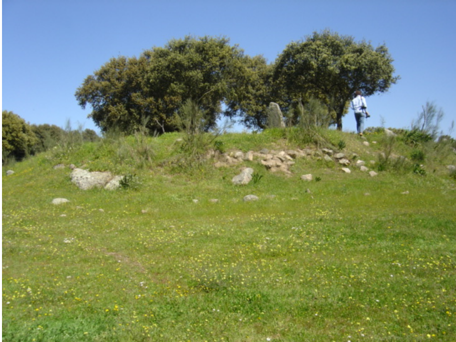
8 – Anta do Vale de Bêbedas