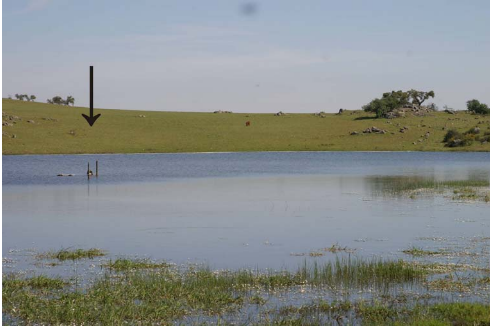
12 – Anta de Santo António submersa