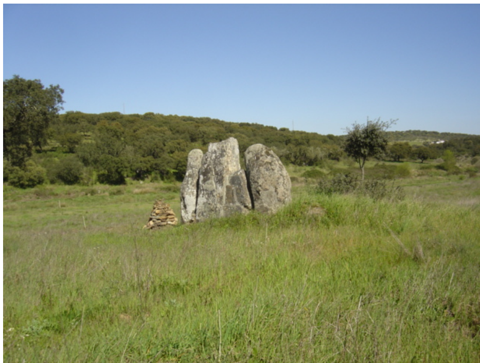
6 – Anta da Casa Branca