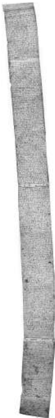
Fig. 1. Recto do Tombo das Viñas de Ribadavia

mencionado por Ferro Couselo (1957) nun artigo publicado en Vida Gallega en 1957. Hai que facer constar, non obstante, que tanto Leirós coma Olga Gallego, que transcribe parcialmente o pergamiño, ou Ferro Couselo, que comenta algúns datos do documento, só fan mención ao contido do recto, non sei se porque o verso o consideran unha continuación ou se porque para eles carece de interese. Só Olga Gallego fai mención á particularidade da lingua en que está escrito.