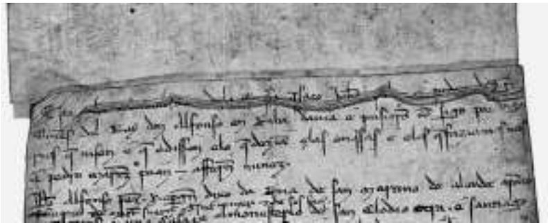
Fig. 2. Detalle do anaco inicial do recto pergamiño, cosido con cordel.

O contido do texto borrado fai referencia ao aforamento dunha viña do mosteiro de Santa María de Melón.