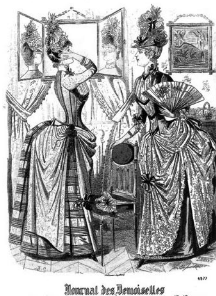
Figura 2. Senhoras com tournures ou almofadas de crina com aros de aço, colocadas ao fundo das costas presas ao espartilho

O seu banimento do vestuário feminino acompanha alterações significativas no papel das mulheres na sociedade do seu tempo.