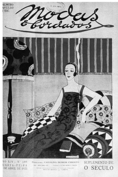
Figura 10. Uma “garçonne portuguesa”.

O visual garçónico começa a perder importância a partir de 1926-1928, acompanhando o fim da I República e os anseios de ordem. Os papéis tradicionais da mulher na sociedade como esposa, mãe e dona de casa nunca foram, porém, questionados (Marques, 2007). Os velhos do Restelo podiam descansar... A importância concedida à família como fundamento da ordem social mantinha-se inalterável. O novo visual constituiu, inclusive, uma etapa decisiva no nascimento da sociedade de consumo pelo desenvolvimento que vai imprimir a todo um conjunto de indústrias correlacionadas com o novo conceito de beleza (cosmética, farmacêutica, turística, etc.).