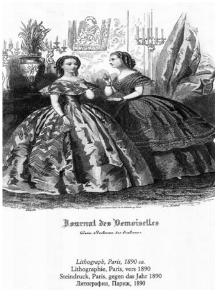
Figura 1. Senhoras com crinolinas, também chamadas “saias-balão”

Desde finais do século XIX, mas com particular insistência a partir do início do século XX, que se vinha assistindo a uma alteração dos cânones estéticos da beleza feminina, bem expressa num novo tipo de silhueta, alongada e esguia, em substituição das formas opulentas, de forte cunho maternal, que dominaram parte da centúria de Oitocentos. Trata-se de um tipo longilíneo que deixou numerosos testemunhos nas artes e letras do tempo, desde a pintura de Modigliani e de Vlaminck, passando pelos grandes costureiros que se afirmavam no campo da moda, como é o caso de Poiret e Madeleine Vionnet, entre outros exemplos que se poderiam citar.