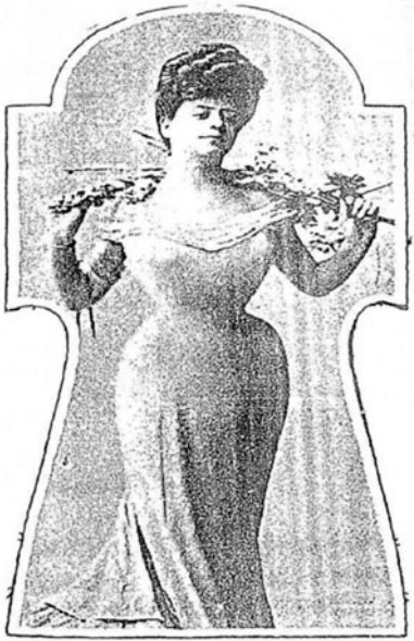
Figura 4. A silhueta em “S”, comum no início do século XX. O espartilho, ao apertar a cintura, realçava o busto, criando o efeito chamado “peito de pomba”.