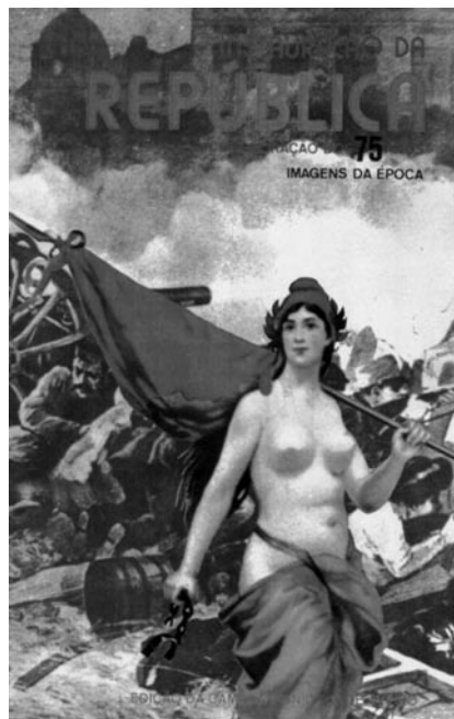
Figura 3. Uma imagem da “República”, a partir de uma litografia de 1910.

Sintomático desse “imperialismo estético” é o volumoso acervo de anúncios a tónicos e as reconstituintes nas páginas da imprensa do tempo. É o caso, entre outros exemplos representativos, da Ilustração Portuguesa , uma revista de grande divulgação nos finais do século XIX e no início do XX, onde aquela publicidade é dominante. Mais precisamente, no período de 1884 a 1892, os anúncios a esse tipo de produtos representam 35% de toda a publicidade da revista (Pereira; Pita, 1993, 502).