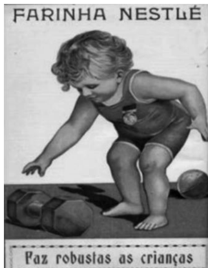
Figura 9. Publicidade à farinha Nestlé que “faz robustas as crianças”.