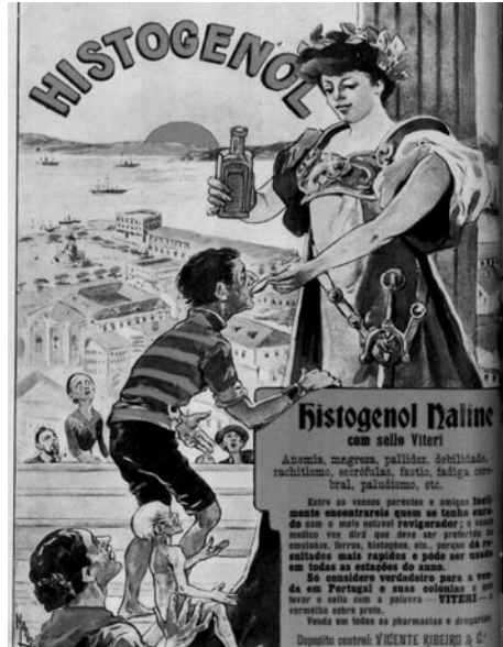
Figura 7. Anúncio a um tónico “Histogenol”.

No ano de 1908, aquele jornal levará a cabo uma intensa campanha intitulada “Regeneremos a raça”, apelando à urgência da criação de mecanismos de prevenção social (lactários, gotas de leite 7 , creches, etc.), ao mesmo tempo que procurava incentivar os cuidados básicos a prestar à 1ª infância. Como fundamento deste apelo dramático, encontravam-se as estatísticas e os inquéritos feitos às crianças de bairros pobres, sobretudo das cidades de Lisboa e do Porto: a hipotrofia era a regra; o peso situava-se sempre abaixo das médias; os sinais de degenerescência eram comuns (ventres deformados e dilatados, corpos escrufulosos e raquíticos...). “Parada da miséria” qualifica o jornal O Século 8 , concluindo pela “urgentíssima missão de acudir ao definhamento pavoroso da raça”. Essa cruzada será, sobretudo, encabeçada por médicos que acreditam que, por meio da instrução, da higiene, da moralização dos costumes e, em particular, da alimentação, é possível melhorar as características físicas das crianças das camadas mais desfavorecidas da população urbana.