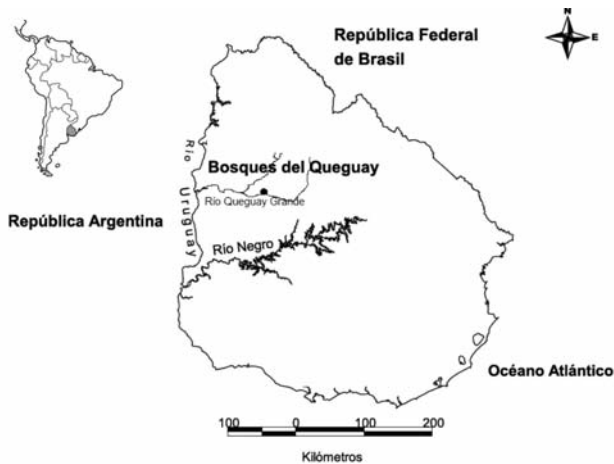
Figura 1.- Ubicación del sitio de estudio

realizaron 102 estaciones de muestreo durante Marzo y Junio de 2010. Se realizó un muestreo cuantitativo en el que se empleó la metodología de los cuadrantes centrados (Matteuchi & Colma 1982). En cada transecto se definieron estaciones cada 20 m desde el margen del río al borde del bosque (Figura 2). El número de estaciones en cada transecto fue variable, según el ancho del bosque en cada zona, el cual presentó un rango de 150 a 600 m. En cada estación, se dispuso un punto central y se delineó un par de coordenadas ortogonales, obteniéndose así cuatro cuadrantes de 10 m de lado (Figura 2). En cada cuadrante, se ubicó el individuo arbóreo más cercano al punto central de la estación, se identificó y clasificó la especie, y se midió: la distancia al punto central de la estación, el diámetro a la altura del pecho (DAP) y la altura. Para las medidas de distancia y DAP se utilizaron cintas métricas, mientras que la altura fue estimada visualmente con un marco de referencia. Se consideraron únicamente los ejemplares con un DAP mayor a 2 cm y en el caso de los arbustos, árboles ramificados desde la base o la especie Terminalia australis Cambess, se sumaron las ramificaciones principales.