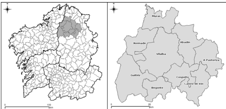
Figura 1.- Situación da comarca de Terra Chá en Galicia

A información de partida empregada no estudo é unha mostra sistemática de 7.274 puntos (seguindo unha malla cadrada de 500 m de lado), na que se dispón de información relativa ó tipo de cuberta (agrícola, mato, arborado, outras) tanto para o ano 1956 como para 2004. A cuberta correspondente a 1956 foi obtida mediante fotointerpretación das fotografías aéreas do voo da serie B do Centro Cartográfico e Fotográfico do Exército do Aire (1956-1957), mentres que a cuberta de 2004 foi derivada de xeito automático do Sistema de Información Geográfica de Parcelas Agrícolas (SIGPAC) na súa primeira edición (o proceso aparece detallado en Corbelle Rico & Crecente Maseda, 2008). A mostra descrita complementouse cun conxunto de variables de tipo biofísico, estrutural e socioeconómico (táboa 3) procedentes de diversas fontes cartográficas e documentais. As variables biofísicas foron obtidas da base cartográfica de Galicia a escala 1:5.000, o Atlas climático de Galicia (Martínez Cortizas, A. & Pérez Alberti, A., 1999), as bases de datos do antigo Instituto Nacional de Meteoroloxía (2000), a base cartográfica do Sistema de Información Territorial de Galicia (2009), e o Sistema de Información Geográfica de Parcelas Agrícolas (Min. De Medio Ambiente, Medio Rural y Marino, 2009). As variables estruturais foron obtidas do xa citado SIGPAC, das bases de datos da elaboración da Enquisa de Infraestruturas e Equipamentos Locais da provincia de Lugo