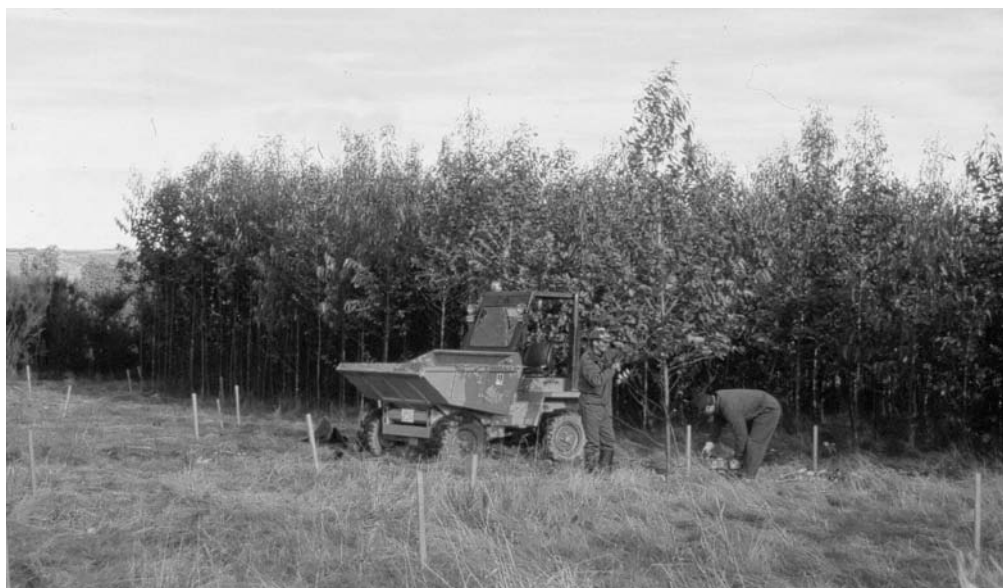
Foto 2.- Ensayos de diferentes cultivos de biomasa en los suelos de las escombreras de la mina de lignitos de As Pontes. Los resultados se encuentran sintetizados en la Tabla 6.