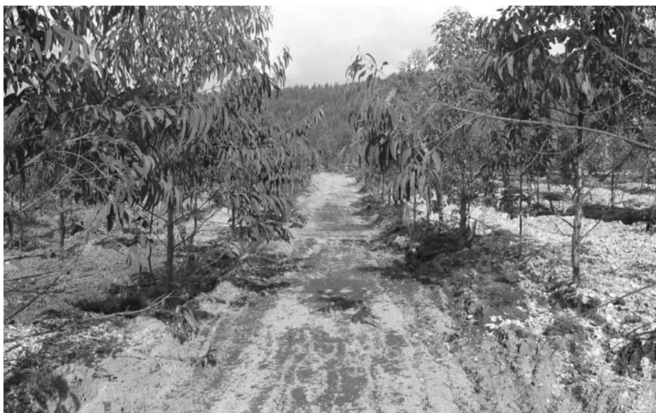
Foto 3.- Ensayos de recuperación de suelos de escombrera de la mina Touro mediante la adición de residuos alóctonos para la elaboración de "suelos artificiales". Se aprecian residuos de cenizas de combustión de biomasa, lodos de depuradora ricos en celulosa y conchas de mejillón.

Finalmente, otros aspectos a considerar dentro de un proceso de optimización, serían los referentes a la calidad del C fijado, es decir su labilidad o recalcitrancia, lo que nos llevaría a preferir, en igualdad de condiciones productivas, plantas ricas en aportes ricos en lignina. Asimismo, los ciclos de vida de los productos obtenidos a partir de las cosechas forestales deben ser calculados y prolongados en lo posible.