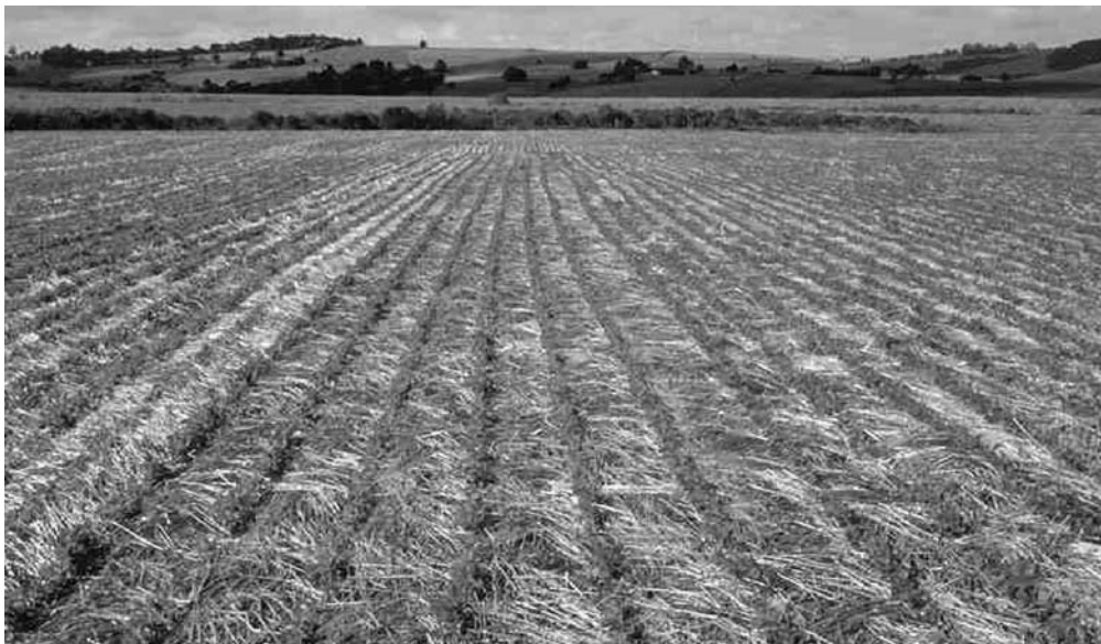
Foto 1.- Ensayo de cultivo de soja mediante siembra directa en Ponta Grossa (Paraná-Brasil) (Foto de Joao Carlos de Moraes Sá).