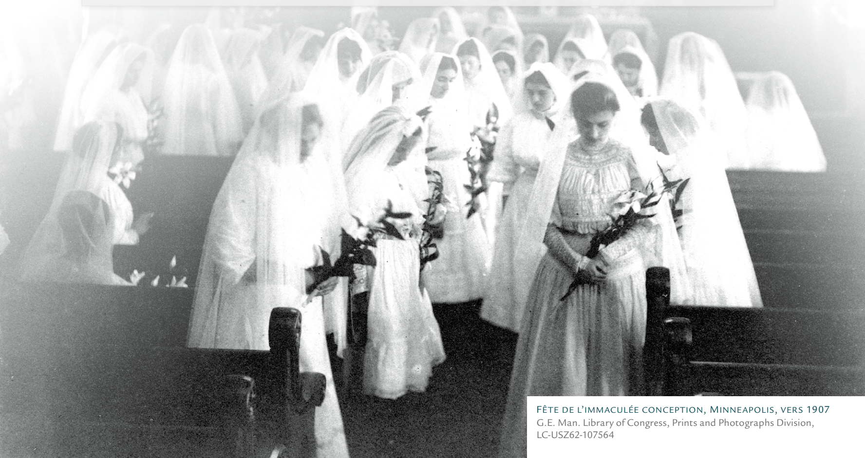
FÊTE DE L'IMMACULÉE CONCEPTION, MINNEAPOLIS, VERS 1907