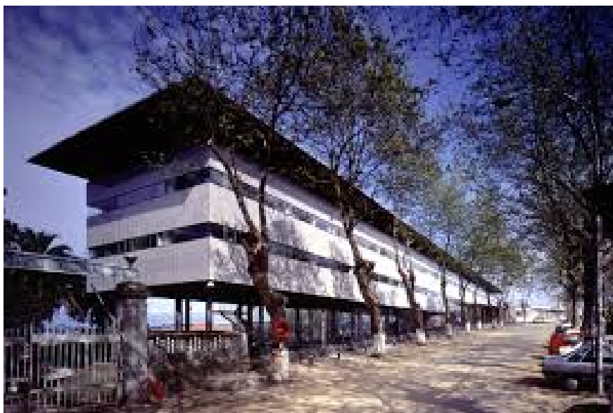
Imagen 1. Hospital Marítimo de Oza (CHUAC)

El ámbito de estudio son los pacientes intervenidos de una reparación artroscópica del manguito de los rotadores en la Unidad de Cirugía de hombro del CHUAC y que son derivados de traumatología a la Unidad de Fisioterapia del Hospital Marítimo de Oza perteneciente al CHUAC (Imagen 1).