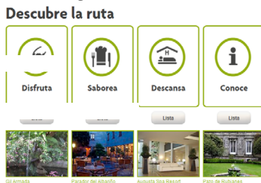
Figura 3: Configuración de los elementos de la ruta del vino

La Ruta del Vino Rías Baixas publicita para el turista una serie de recursos complementarios tales como patrimonio cultural e histórico, naturaleza o museos. En la época estival se desarrollan celebraciones de exaltación de la cultura del vino, donde destaca por su difusión y visitantes la Fiesta del vino Albariño de Cambados y la Fiesta del vino de O Rosal. En la Figura 3 se observa la configuración de los elementos de esta ruta del vino. En ella se pueden ver destacados los cuatro factores esenciales definidos a través de las variables disfruta, saborea, descansa y conoce.