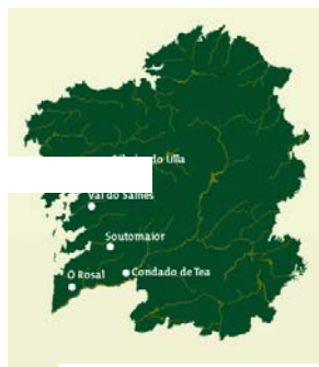
Figura 1: Principales subzonas de producción D.O. Rías Baixas

El territorio de la Denominación de Origen Rías Baixas integra 33 municipios, pertenecientes a la provincia de Pontevedra y A Coruña, y distribuidos en cinco áreas principales, abarcando desde el norte de Portugal hasta cerca de Santiago de Compostela. Como se comprueba en la Figura 1, en la provincia de Pontevedra se extiende el Val do Salnés, O Rosal, Condado de Tea y Soutomaior. El área de Ribeira do Ulla se encuentra situada al sur de la provincia de A Coruña y al norte de Pontevedra.