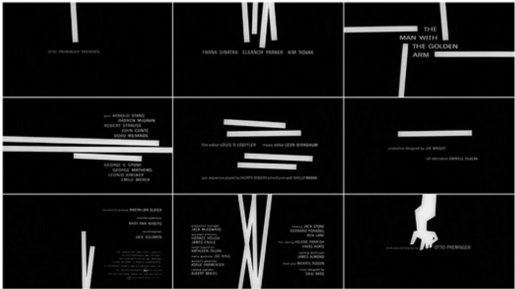
Fig. 5. Saul Bass, El hombre del brazo de oro, dir. Otto Preminger, 1955.

Sin embargo, ¿no debería la performatividad implicar una relación todavía mayor entre espectador y obra?