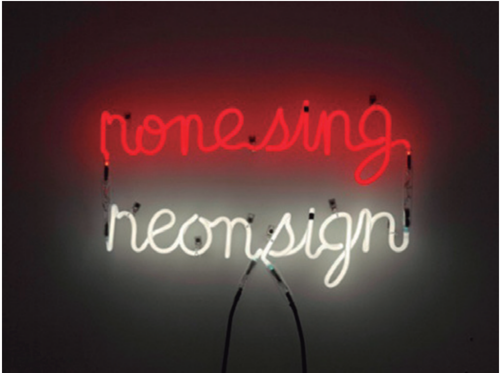
Fig. 3. Bruce Nauman, None Sing, Neon Sign, 1970.

espacio de la galería, Wall Drawings 1968-2007, como en sus instalaciones en tres dimensiones, Maquette for One, Two, Three de 1979, ya introduce primitivamente al espectador en un juego de participación que incorpora una dimensión temporal-experiencial en la obra de arte. Carmen Crouzeilles, explica también el arte óptico como un claro antecedente estético de las poéticas digitales y cómo su natural evolución incluye obligatoriamente el desarrollo de sus posibilidades mediante el medio digital: