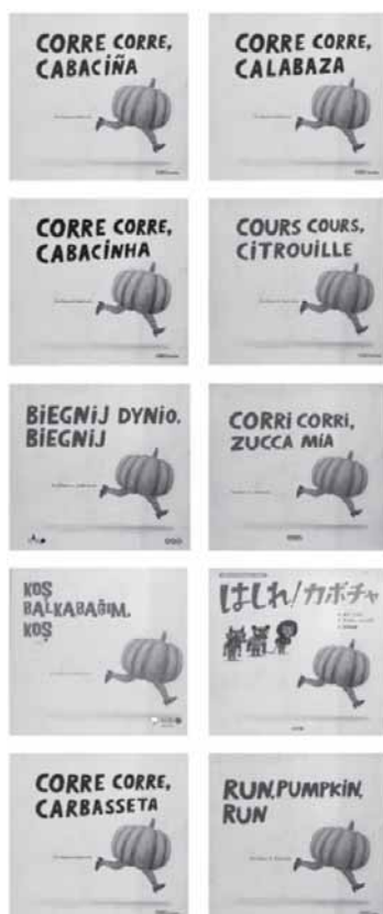
Portada das distintas versións de Corre corre cabaciña, con textos de Eva Mejuto, e ilustracións de André Letria, a partir dun conto popular portugués.