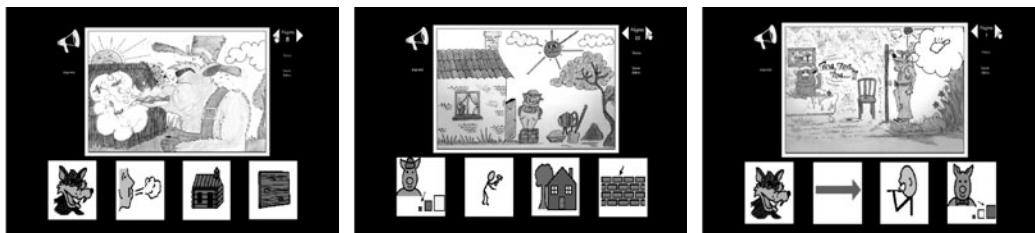
Tabla 1: Ejemplos de actividades realizadas a través de herramientas de las Tecnologías de la Información y las Comunicaciones