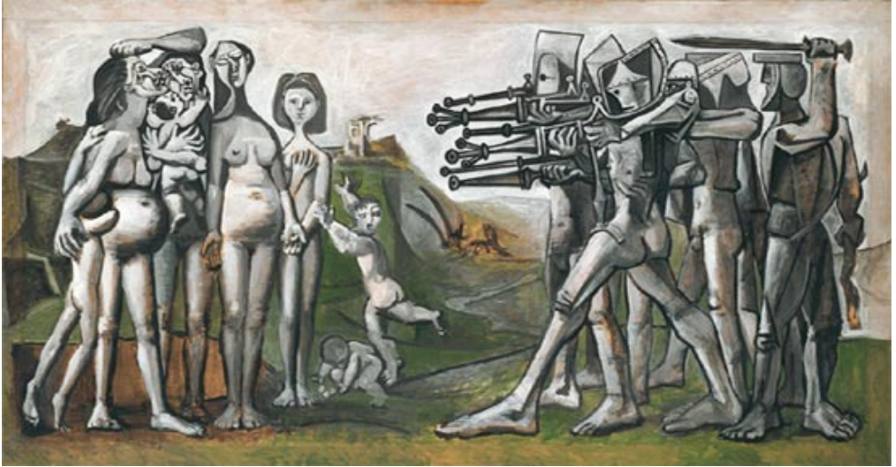
Massacre en Corée. Picasso 1951

En este periodo expansivo de la potencia norteamericana, lo tienen claro, la imagen de héroe y ciudadano ejemplar a transmitir es la de Guzmán el Bueno, es decir, aquel que en una situación de conflicto de rol entre familia y patria escoge a la patria.