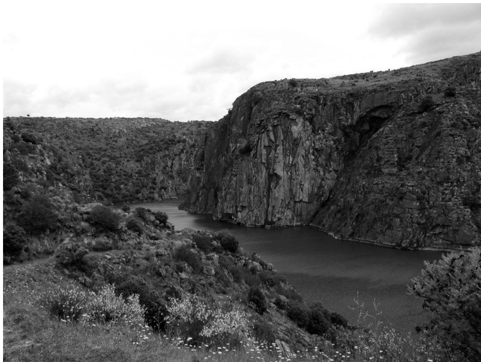
Figura 2. Escarpas do Douro Internacional

A aridez e rudeza da paisagem resultam igualmente de uma gradação climática. Os baixos índices pluviométricos conferem ao clima características marcadamente mediterrâneas, atingindo-se valores de precipitação anual semelhantes aos que se verificam no interior alentejano ou no Algarve (da ordem dos 400 a 500 mm de precipitação, em média, ao longo do ano, chegando mesmo a valores inferiores a 400 mm em determinados locais mais abrigados). Para encontrarmos índices de aridez um pouco mais ténues, com Invernos mais frios e não tão secos, semelhantes ao interior Castelhano-Leonês, temos de nos afastar das zonas mais abrigadas dos vales e de nos aproximar das serranias vizinhas.