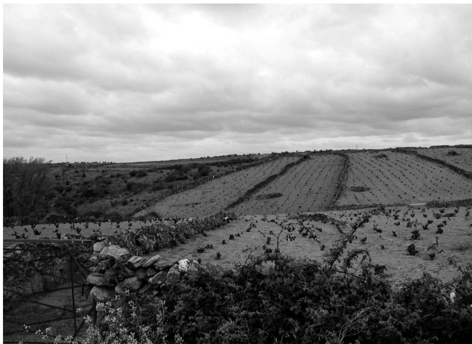
Figura 3 – Vinhas das “Arribes”

Uma das iniciativas mais recentes de nível territorial veio reconhecer o particular valor ambiental do troço internacional do Rio Douro, local de nidificação de numerosas espécies da avifauna (Zona Especial de Protecção de Aves - o Grifo (“ Gypsfulvus ”), a cegonha negra (“ Ciconianigra ”), a águia de Bonelli (“ Hieraaetusfasciatus ”)) e igualmente local de refúgio para espécies de animais em risco, nomeadamente o lobo (“ Canis lupus ”) e o gato-bravo ( Félix silvestris ”). Esta área está incluída em dois Parques Naturais: Parque do Douro Internacional, no caso de Portugal, Parque das Arribas do Douro, no caso de Espanha.