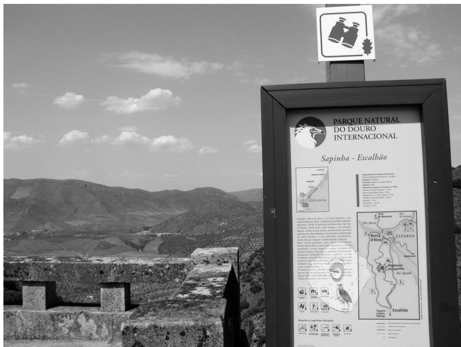
Figura 4- Barca de Alva

Ao sairmos do “Douro granítico” e entrarmos no “Douro do xisto” rapidamente nos apercebemos desta mudança. Na foz do Rio Águeda, em Barca de Alva, o horizonte expande-se. Surgem pequenas porções, de declive suave, onde se cultiva a vinha, a oliveira ou a amendoeira. Em outros locais as vinhas tendem a ocupar terrenos que, pela sua natureza rochosa e em declive acentuado, exigiram um intenso trabalho de preparação do solo e a sua sustentação. Na literatura são frequentes as alusões à dura tarefa que consistiu no erguer dos tradicionais socalcos e na implantação da vinha. Alguns autores chegam mesmo a apelidá-la, de forma alegórica, “uma autêntica labuta de gigantes”; «E resolveram meter o picão às fragas; reduzi-las a terrunha; amparar os seus “veios” estreitos com “socalcos” de pedra solta; e plantar sobre as escarpas, que eram sarças de fogo, os primeiros bacelos de videira» (Cortesão in Andrade, 1990: 19). A vinha, graças à fisiologia das suas raízes que procuram em profundidade nutrientes e água, adapta-se ao solo criado pelo homem após a realização da surribe. Do lado de lá da fronteira, ainda que se trate igualmente de uma paisagem vinhateira, o carácter arcaico ainda é mais acentuado, diferindo, no entanto de forma substancial na topografia (terreno plano onde se inserem pequenas parcelas, rodeadas de muros).