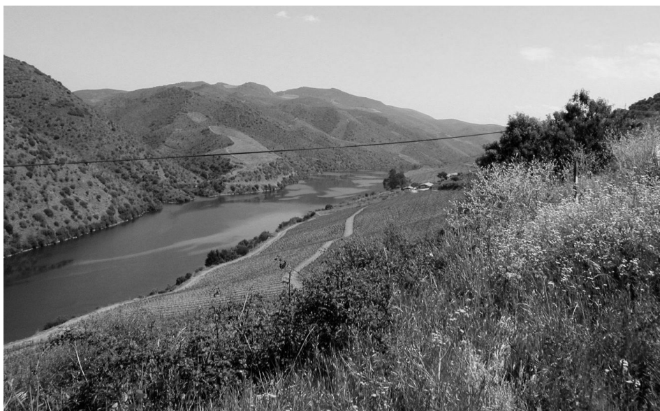
Figura 5-Vale do Côa

Se nas vertentes agricultadas já referimos que o domínio da vinha é avassalador, a cotas mais elevadas, locais que já podemos enquadrar no Douro sub-planáltico, em vertentes de maior declive, existe uma ocupação florestal e de mato sub-atlântico em porções descontínuas e que em determinadas épocas do ano sobressaem pelo seu forte colorido. Destacam-se em Maio os tufos amarelos das giestas. Entre os fundos de vale, de feição tipicamente mediterrânea e a região planáltica existe um domínio fito-geográfico de transição. O seu carácter intermédio permite a coexistência de um estrato arbóreo em que se conjugam espécies como o carvalho roble ( Quercus Robur L. ), o sobreiro ( Quercus Suber L. ), o pinheiro bravo ( Pinus Pinaster Aiton ) e no estrato arbustivo, as já citadas giestas, os tojos ( Ulex Spp. ) o medronheiro ( Arbustus Wedo L. ), o estêvão ( Cistus Populifolius L. ), etc.