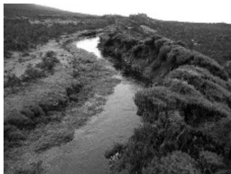
Figura 6. Levada escavada na rocha perto do Pico da Urze, Paul da Serra (R Q -27.12.03)

Como escreveu Maria Lamas, “para este povo, o problema das levadas é a própria Vida. Sem água, as terras permanecerão maninhas. Pela água o madeirense tornou-se gigante a medir forças com outro gigante: a montanha. Pela água foi capaz de arrancar à sua mediana estatura energias sobre-humanas e suprir o que a natureza não lhe proporcionou. Pela água desafiou