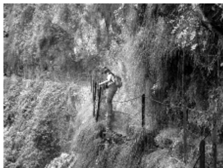
Figure 12 – Levada do Curral e Castelejo (R Q - 13.09.05)

Será uma enorme perda para o património cultural da Madeira, não investir na recuperação da Levada do Curral e Castelejo, que durante cinco séculos permitiu que as gentes do Curral das Freiras viessem ao Funchal vender ameixas e castanhas e le-