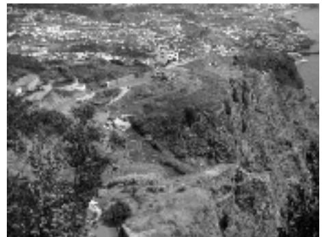
Figura 2. Paisagem para oriente do Cabo Girão (R Q - 18.09.11)

A Madeira tem condições excelentes para oferecer ao amante da Natureza um programa de férias aliciante, com possibilidade de estudar, ou simplesmente observar, plantas, aves e borboletas endémicas; visitar jardins e quintas onde florescem belíssimas plantas das zonas tropicais, subtropicais e temperadas; habitar no meio rural alimentando-se de produtos frescos cultivados nos arredores da residência; fazer longos percursos a pé numa paisagem com formações geológicas monumentais e caprichosas rochas talhadas pelas águas correntes ou pelo vento.