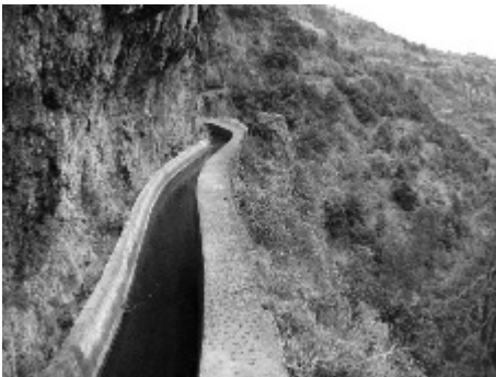
Figura 11 – Levada Nova na Lombada da Ponta do Sol (R Q - 13.01.07)

Face à “importância económica, social e ambiental” dos percursos pedonais nas levadas e veredas, a Assembleia Regional aprovou em 29 de Outubro de 2000, o Decreto Legislativo Regional nº 7-B/2000/M, que estabeleceu um conjunto de 52 “percursos pedonais recomendados” na Ilha