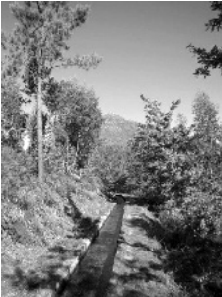
Figura 7. Levada do Piscaredo, Mondim de Basto, com a montanha da Senhora da Graça em fundo (R Q -27.11.11)

Com o crescimento das necessidades de água para irrigar os canaviais e as terras de vinhas, a extensão das levadas foi aumentando e a sua construção exigindo técnicas mais seguras. Os canais construídos em sólida alvenaria substituíram as primitivas calhas de madeira. A utilização de explosivos facilitou imenso a abertura