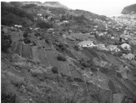
Figura 4. Poios (socalcos) no vale de Machico (R.Q - 12.03.05)

Ainda hoje pouca gente sabe que os maiores túneis da Madeira foram construídos para possibilitar a circulação da água do norte para o sul da Ilha, antes de haver farto dinheiro da União Europeia. O maior, com 5100 metros de comprimento, atravessa a cordilheira central entre a Fajã da Nogueira e a Ribeira de Santa Luzia,