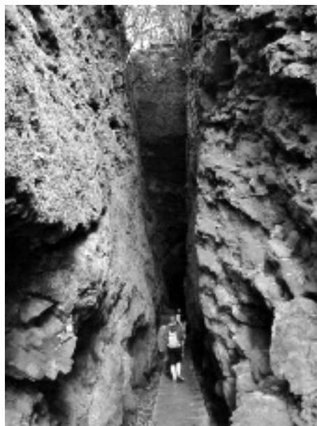
Figura 9. Cabeço Furado, Levada da Serra do Faial (R Q -26.09.10)

Em 1830, um grupo de proprietários agrícolas fundou a Sociedade da Levada Nova do Furado com o objectivo de trazer para o Funchal águas captadas nas ribeiras das Lajes e do Juncal e também do ribeiro Frio. Quarenta anos mais tarde o objectivo da Sociedade ainda não estava cumprido.