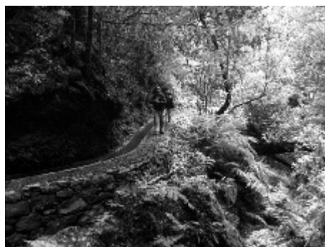
Figura 8. Levada dos Cedros, construída no século XVIII para irrigar os solos agrícolas da freguesia da Ribeira da Janela, atravessa uma área de Laurissilva (R Q -24.05.08)

Os percursos nas levadas possibilitam a descoberta da extraordinária flora da Ilha da Madeira, com espécies únicas no mundo. A flora vascular dos arquipélagos da Madeira e das Selvagens integra um total