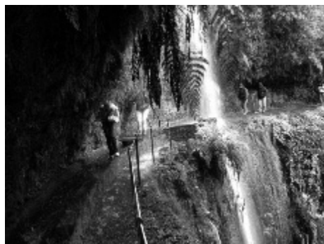
Figura 3. Levada do Rei, perto da origem no Ribeiro Bonito (RQ – 29.03.09)

Afonso de Albuquerque, governador da Índia de 1508 a 1515, distinguiu-se entre os que lutaram para destruir a navegação árabe e enfraquecer os seus principais pólos comerciais. Para atingir esses objecti-