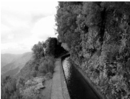
Figura 13 - Levada do Alecrim, Paul da Serra (RQ - 07.05.11)

A Levada da Silveira em Santana, a Levada da Água de Alto no Faial, a Levada que abastece a Central Hidroelétrica da Ribeira da Janela, a Levada dos Tornos entre o Lombo do Urzal e a Fajã do Penedo, a