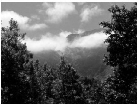
Figura 1. Laurissilva, a floresta indígena da Madeira, classificada pela UNESCO como Património Natural da Humanidade (R Q - 07.08.10)

A especificidade ecológica desta ilha vulcânica não pode ser banalizada pelo turis-