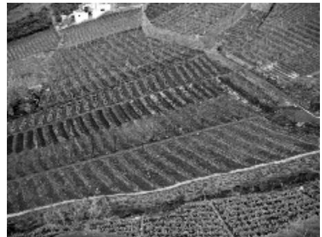
Figura 5. Policultura no sítio da Caldeira, Câmara de Lobos (R.Q - 31.01.05)

A pequenez das parcelas, que mais parecem quintais meticulosamente cuidados apenas com trabalho manual, e a falta de acessibilidade – ainda hoje é preciso transportar às costas por íngremes escadarias os produtos da terra – são factores que têm contribuído para o abandono de muitas explorações.