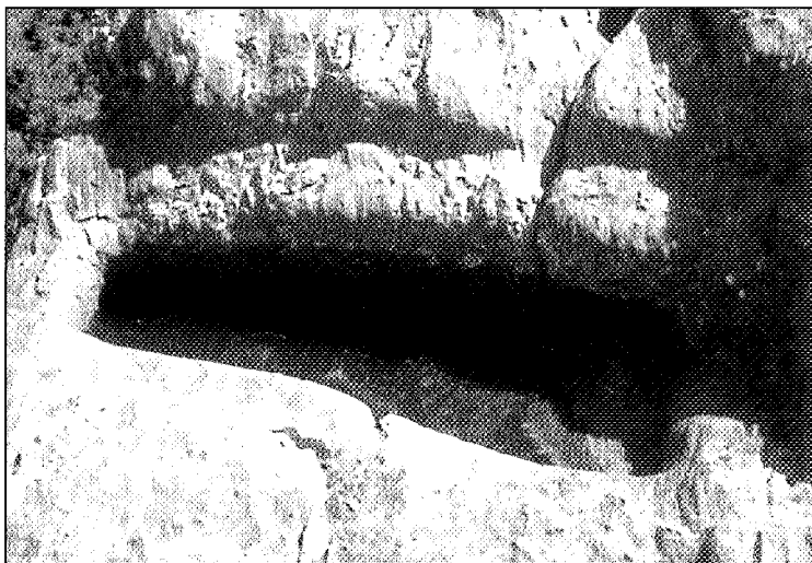
Sartego antropomorfo fixo de Pico Ferreira