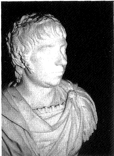
Fig. 3.—Retrato de Manuel Godoy, por Juan Adán.

El boceto de Francisco Gutiérrez para la urna del sepulcro, conservado en la Academia, ha sido recientemente restaurado, comprobándose la conformidad absoluta entre boceto y relieve en mármol. Es una composición neoclásica, dispuesta en forma horizontal, en relieve descriptivo, pero acomodado a una ordenación en perspectiva. Grandes pilares, revestidos de columnas y capiteles jónicos, soportan las bóvedas de un edificio que semeja forma de basílica, pero dispuesta en oblicuo. De esta manera se contraponen la visión frontal de los personajes y la perspectiva diagonal, de abajo hacia arriba. El relieve es de numerosos planos, de suerte que el grosor va lentamente disminuyendo, para poder de esta suerte dar cabida a las numerosas figuras que componen la escena. En cuanto a lo que representa, viene a ser una modificación del relieve de la Fundación de la Real Academia que había realizado Felipe de Castro en 1752. Fernando VI se