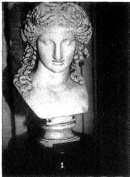
Fig. 4.—Baco, por Pascual Cortés.