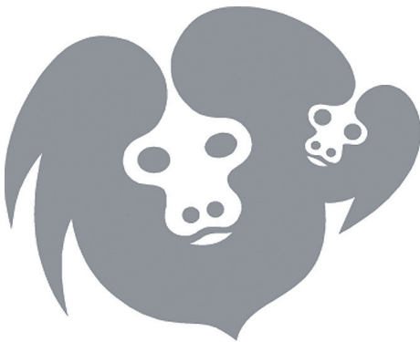
Figura 2. Logomarca criada para o Programa de Conservação para o Mico-Leão-Dourado. Atualmente é a logomarca da Associação Mico-Leão-Dourado.

Os conhecimentos sobre o mico-leão-dourado e seu hábitat, gerados ao longo de décadas de estudos conduzidos pela PCMLD e colaboradores, possibilitaram a utilização de uma ferramenta conhecida como Análise de Viabilidade de População e Hábitat (em