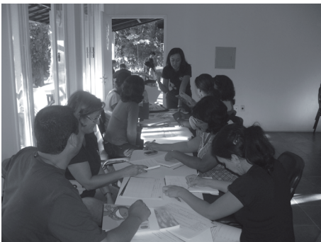
Foto 3. Planejamento do projeto educativo.