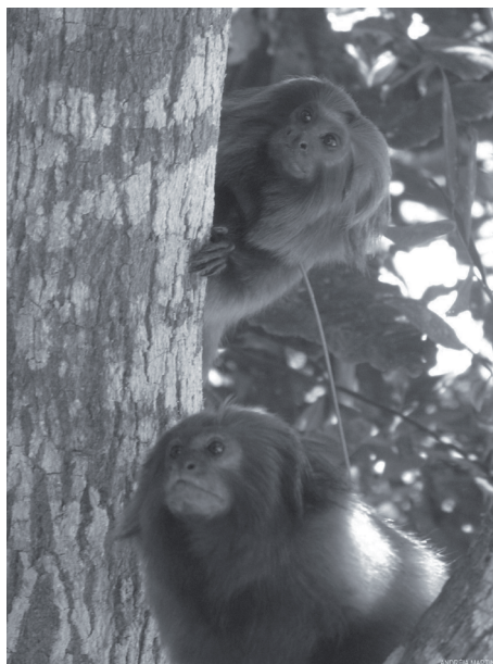
Figura 1. Micos-leões-dourados.

Na Lista Vermelha de Espécies Ameaçadas de Extinção, divulgada em 2003 pela