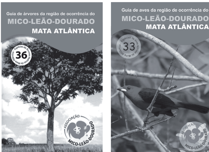
Figura 4. Guias educativos sobre árvores e aves da Mata Atlântica.

educativos dos professores. Já foram elaborados dois guias: um com descrição de 36 espécies de árvores nativas da Mata Atlântica, e outro com 33 espécies de aves nativas da Mata Atlântica (Figura 4).