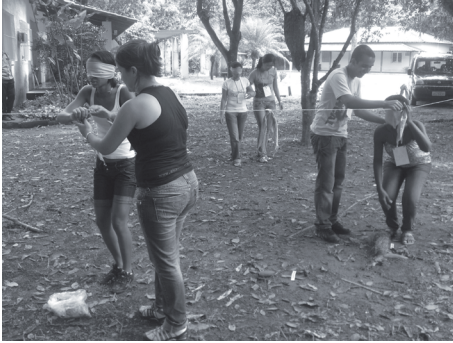
Foto 1. Dinâmica de sensibilização – utilização dos outros sentidos para conhecer elementos da Mata Atlântica.

as escolas e Secretarias de Educação dos municípios envolvidos. O monitoramento e avaliação é realizado através de questionários, conversas informais e fotografias.