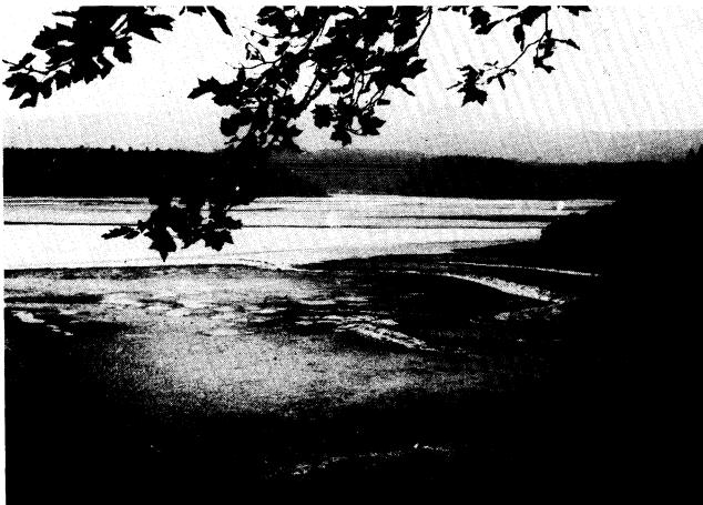
Fig. 3.- Zona central del Estuario del Eo en primer lugar el seno de las Aceñas, / ocupado por limos; al fondo el entrante / del "Barco del Cura" y en el centro los / tesones de arenas y cienos.

La configuración del estuario del Eo es alargada, de hábito prismático (fig.1) en su conjunto, con una longitud de tres ki-