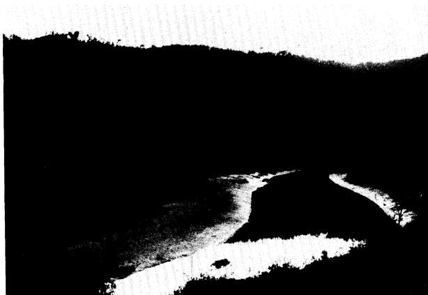
Fig. 4.- Seno de Reme. Tramo final del río Grande en las proximidades del estuario, aterrazamientos limosos granudos y plásticos (shorre y slikke).

sinuosidades están asociadas a pequeñas ensenadas y senos de desembocaduras fluviales (ríos y arroyos) cubiertos por materiales limo-arenosos (fig. 4). El frente acantilado es en general bajo (falsos cantiles, fig. 2), cuyas partes altas cubiertas de vegetación corresponden a antiguas laderas de vertientes actualmente rebajadas por procesos erosivos subaéreos, con presencia de terrazas fluviales, algunas de ellas modificadas por retoque marino (Asensio Amor, 1.970).