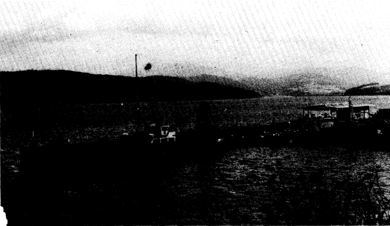
Fig. 2.- Estuario del Eo, en primer término el / muelle de Mirasol en Ribadeo; a derecha e izquier / da las márgenes gallega y asturiana, respectiva- / mente, al fondo la zona de marismas.

La configuración del estuario del Eo es alargada, de hábito prismático (fig.1) en su conjunto, con una longitud de tres ki-