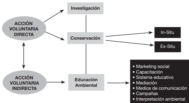
Gráfico 3: Estratexias da acción voluntaria para a conservación da biodiversidade. (Castro,2001)

A xeito de exemplo imos referir sinteticamente algúns dos programas e iniciativas de conservación de fauna ameazada que se están a desenvolver con participación de persoas voluntarias. Estas experiencias configuráronse pola alianza construtiva entre entidades ambientalistas e sociais, xestores e científicos, e constitúen en moi-