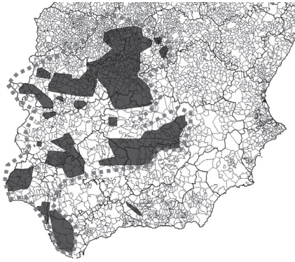
Plano 1: Ámbito de actuación

A contribución á recuperación da aguiá imperial ibérica desde o programa "Alzando o voo" formúlase coa incorporación de medidas de xestión para a mellora do seu hábitat, medidas de xestión que fomenten as poboacións da súa principal presa, o coello, a loita contra as principais ameazas que afectan a especie, e, por suposto, coa participación e sensibilización de todos os sectores e actores sociais que conviven coa especie e que dun xeito ou outra están implicados na súa conservación. Para levar a cabo este traballo e alcanzar estes obxectivos é indispensable recorrer aos instrumentos sociais obxecto deste seminario: a comunicación, a educación, a participación e a sensibilización, que serán utilizados para desenvolver as tres liñas principais de actuación nas que se estrutura o Programa "Alzando o voo": Xestión de hábitat, conservación e participación, e sensibilización e difusión.