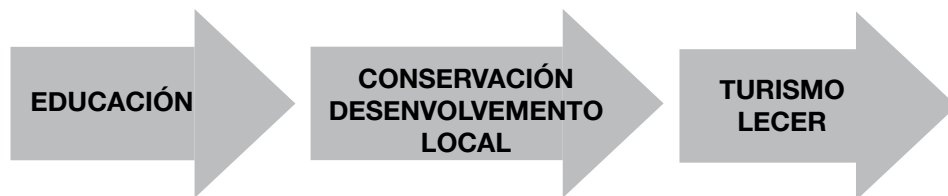
Cadro nº 2: Evolución dos equipamentos para a educación ambiental según a actividade principal

Na actualidade son 7 as comunidades autónomas que iniciaron este proceso de procura da calidade, procesos tan