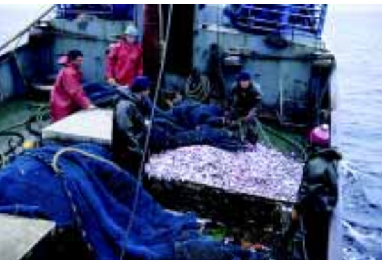
Trabajo a bordo de un arrastrero.