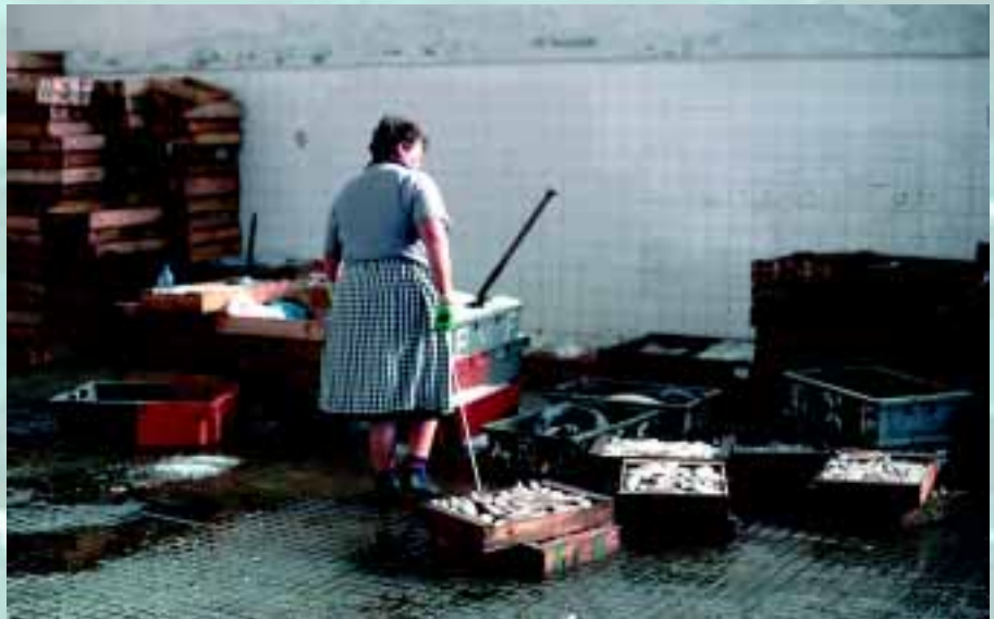
Las capturas están descendiendo.

En ciertos contextos, en general ligados a pesquerías industriales fuertemente capitalizadas, se han desarrollado sistemas de propiedad privada –basados en los sistemas de cuotas individuales transferibles (ITQ, en inglés)– que se han planteado como alternativas exitosas al acceso abierto. Países como Nueva Zelanda e Islandia fueron pioneros en el desarrollo de estos sistemas, que en la actualidad gozan de gran popularidad en diversas áreas geográficas. Aunque estos sistemas han gozado de un éxito relativo en la gestión sostenible de los recursos, han aparecido nuevos problemas como la concentración de cuota en unas pocas empresas que pueden monopolizar la explotación y las decisiones sobre gestión, que se limitan en general a objetivos económicos. Por otra parte, la propiedad privada no excluye la sobreexplotación, dado que en condiciones en que los tipos de interés superen la tasa