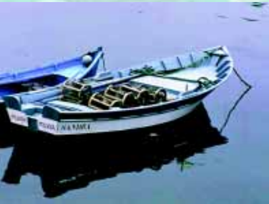
Chalanas con nasas.

en general exitosos, permitiendo una explotación sostenible de los recursos y la conservación de los ecosistemas, manteniendo la cohesión social y la eficiencia económica de las comunidades implicadas. Existen numerosos ejemplos en lugares tan dispares como Chile, México, Indonesia, Filipinas, Estados Unidos o Canadá, en estos últimos casos ligados a los derechos de explotación de los grupos indígenas. En España, y en concreto en Galicia (4), aunque la situación actual de la pesca artesanal es de una profunda crisis ligada a un sistema de gestión centralizado, han surgido recientemente planes de explotación del percebe o del marisqueo de bivalvos diseñados y gestionados por cooperati-