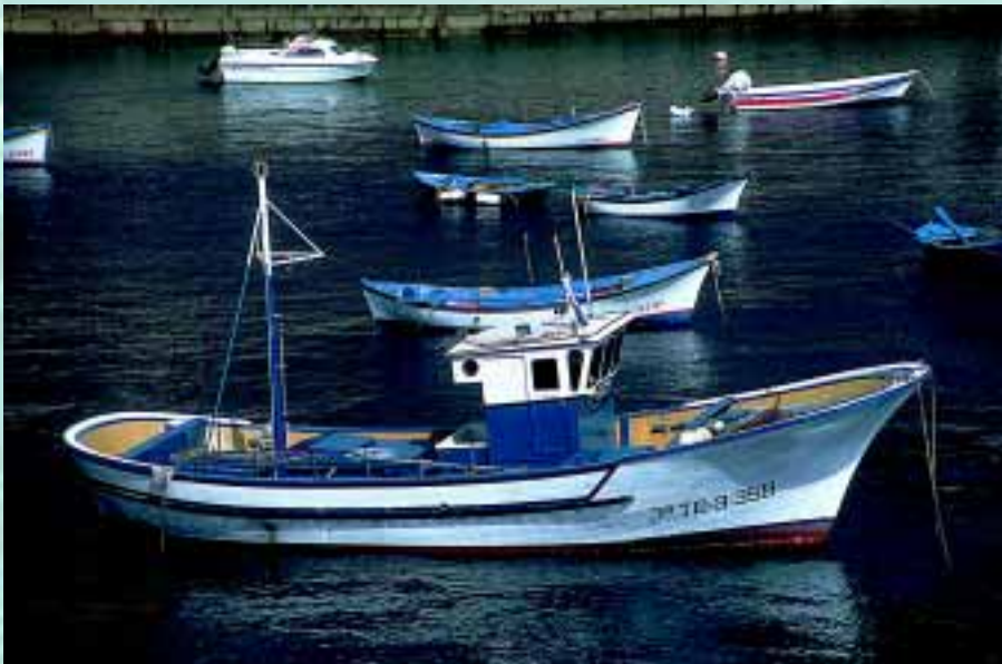
Muchas personas viven de la pesca artesanal.