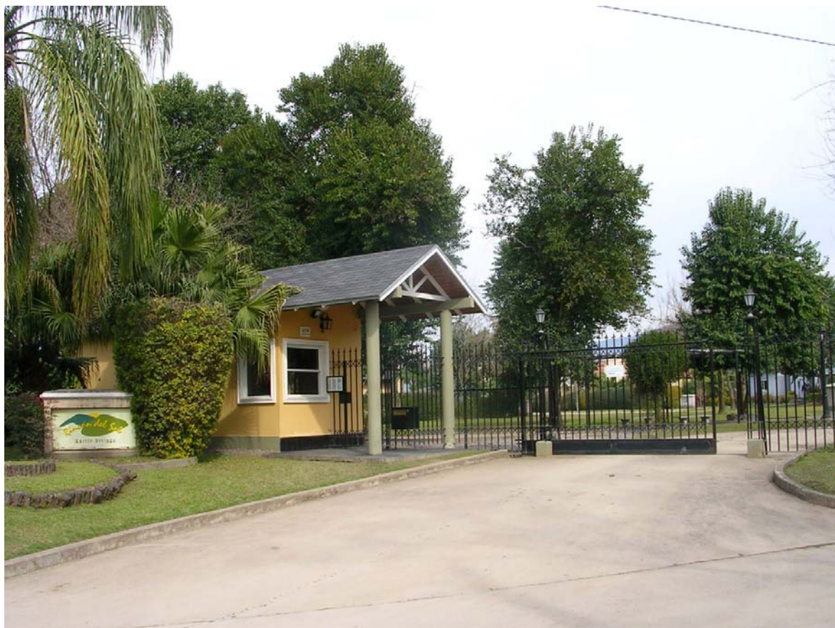
Foto 1. Fachada Barrio Privado Rincón del Sol 1

por el cual están localizados es las afueras del municipio. Este es el caso de los barrios cerrados El Típal y Los Cerros que están ubicados en la ladera de la Sierra de San Javier 14 . (Foto 1)