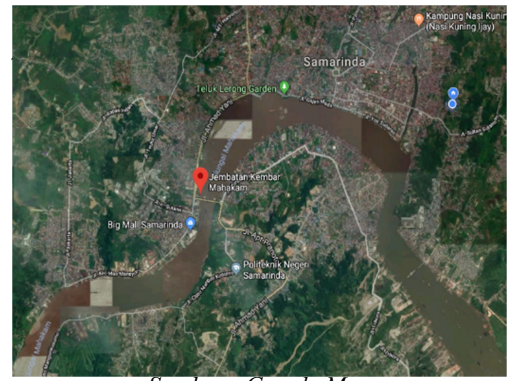
Gambar 1 Peta Lokasi Proyek Pembangunan Jalan Pendekat Jembatan Mhaakam IV Sisi Samarinda Kota