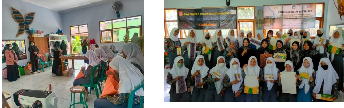
Gambar 2. Dokumentasi pelaksanaan pelatihan

Pelaksanaan kegiatan PKM dilakukan di SMA Negeri 1 Karas yang beralamatkan di Jl. Raya Karas, Punden, Kuwon, Kec. Kendal Kabupaten Magetan pada tanggal 28 Juli 2022. Kegiatan PKM dilaksanakan di salah satu laboratorium tata busana SMA Negeri 1 Karas. Peserta kegiatan PKM adalah siswi SMA Negeri 1 Karas yang menempuh ekstrakurikuler tata busana dalam sebagai salah satu program double track di SMA Negeri 1 Karas.