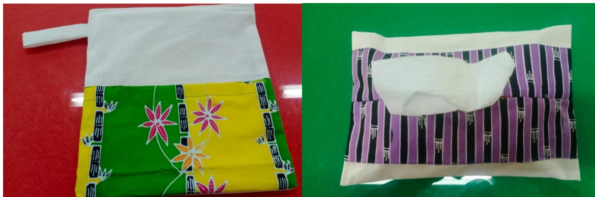
Gambar 3. Produk souvenir yang dihasilkan

Berkaitan dengan materi pelatihan yang telah diberikan dilakukan evaluasi dan didapatkan respon peserta sebagai berikut;