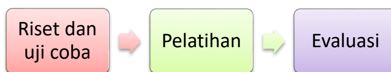
Gambar 1. Bagan alur pelaksanaan kegiatan

Metode pelaksanaan program pelatihan ini yang pertama dilakukan adalah riset dan uji coba produk oleh tim pelatih kegiatan. Riset dan uji coba produk dilakukan untuk memastikan produk yang nantinya dijadikan sebagai produk pelatihan layak dan sesuai untuk dijadikan sebagai prototype pelatihan, setelah riset dan uji coba produk berhasil kemudian dilaksanakan pelatihan sesuai jadwal yang telah ditetapkan dengan menggunakan metode pembelajaran langsung dengan cara pelatih mendemonstrasikan dan mempraktikkan secara langsung prosedur pembuatan produk. Tahapan yang terakhir adalah evaluasi pelaksanaan pelatihan dengan metode rubrik penilaian dan angket.