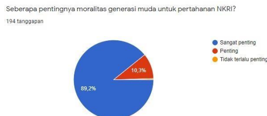
Gambar 4.3 Moralitas generasi muda

Moralitas merupakan suatu hal penting yang harus disadari mahasiswa bahwa bangsa dan negara akan berkembang menjadi negara yang maju jika kaum mudanya memiliki moralitas yang baik. Hal ini ditunjukkan dalam survey pada Gambar 4.3 berikut ini :