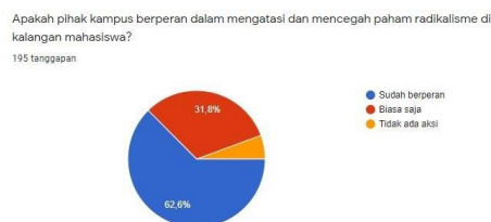
Gambar 4.5 Peran Universitas Terhadap Radikalisme

Upaya lainnya adalah peran Universitas untuk selalu mengawasi kegiatan mahasiswa agar mencegah merebaknya paham radikalisme dan bertindak tegas tepat apabila ditemukan perilaku menyimpang. Berikut Gambar 4.5 adalah penilaian mahasiswa terhadap peran Universitas terhadap radikalisme.