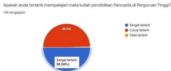
Gambar 4.1 Survey Minat Mahasiswa Terhadap Mata Kuliah Pendidikan Pancasila

Kemintaan mahasiswa ditunjukkan dalam hasil survey berikut ini :