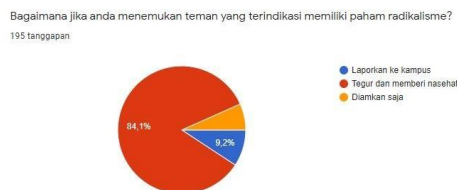
Gambar 4.4 Upaya mencegah Radikalisme

Mahasiswa adalah generasi muda yang terdidik dan merupakan potensi dan harapan bangsa sebagai pelaku pembangunan di masa depan. Timbulnya masalah radikalisme harus diantisipasi dengan pendekatan yang sistemik dan strategis melalui jalur dialog serta edukasi. Dalam memberikan pemahaman kepada mahasiswa kelompok ini melalui berbagai jalur, seperti: Kos-kosan, Masjid, Mentoring, Kampus, asrama, masjid fakultas, dan universitas. Dalam survey, sebagian mahasiswa Program Studi Teknik Industri akan menegur dan memberi nasihat jika menemukan teman yang terindikasi memiliki paham radikalisme. Hal demikian sebagai salah satu upaya yang dilakukan oleh mahasiswa untuk membentengi diri dan menjaga dari pandangan menyimpang tentang agama dan negara. Berikut Gambar 4.4 menunjukkan upaya tersebut.