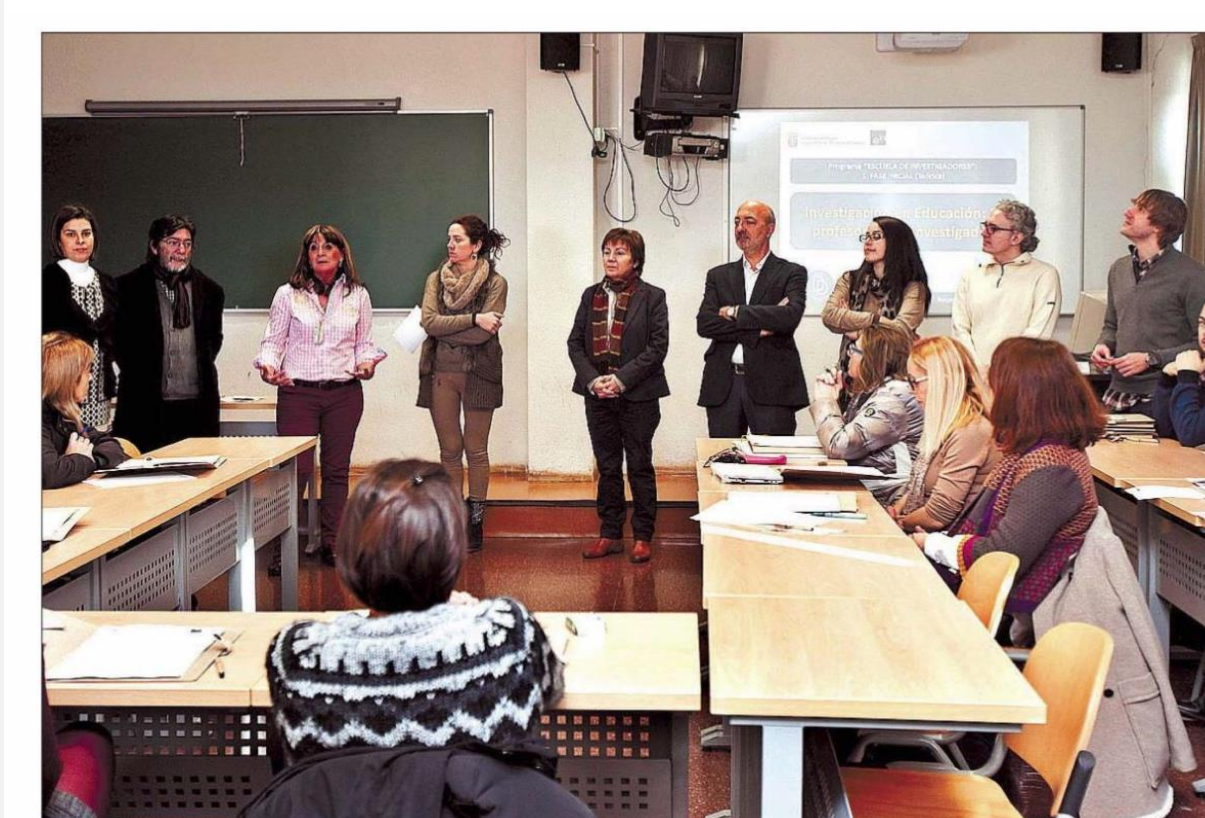
Escuela de Investigadores. La Facultad de Educación de la UBU acogió ayer la primera jornada de la primera fase del Programa Escuela de Investigadores, en el que participan 30 profesores de centros de Educación Infantil, Primaria y Secundaria de Castilla y León. Se trata de un programa de innovación educativa de la Junta que busca experimentar nuevas metodologías de formación del profesorado.

Fecha: 27/01/15 Sección: Burgos Página: 14