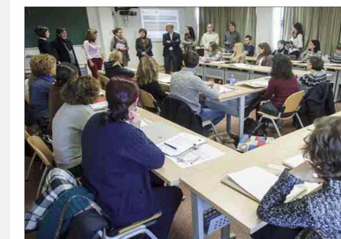
Un momento de la presentación de la Escuela de Investigadores, ayec, en la Facultad de Educación. Los docentes para investigar técnicas para investigar El Centro Superior de Formación del Profesorado inauguró ayer la primera Escuela de Investigadores que se desarrolla en la UBU