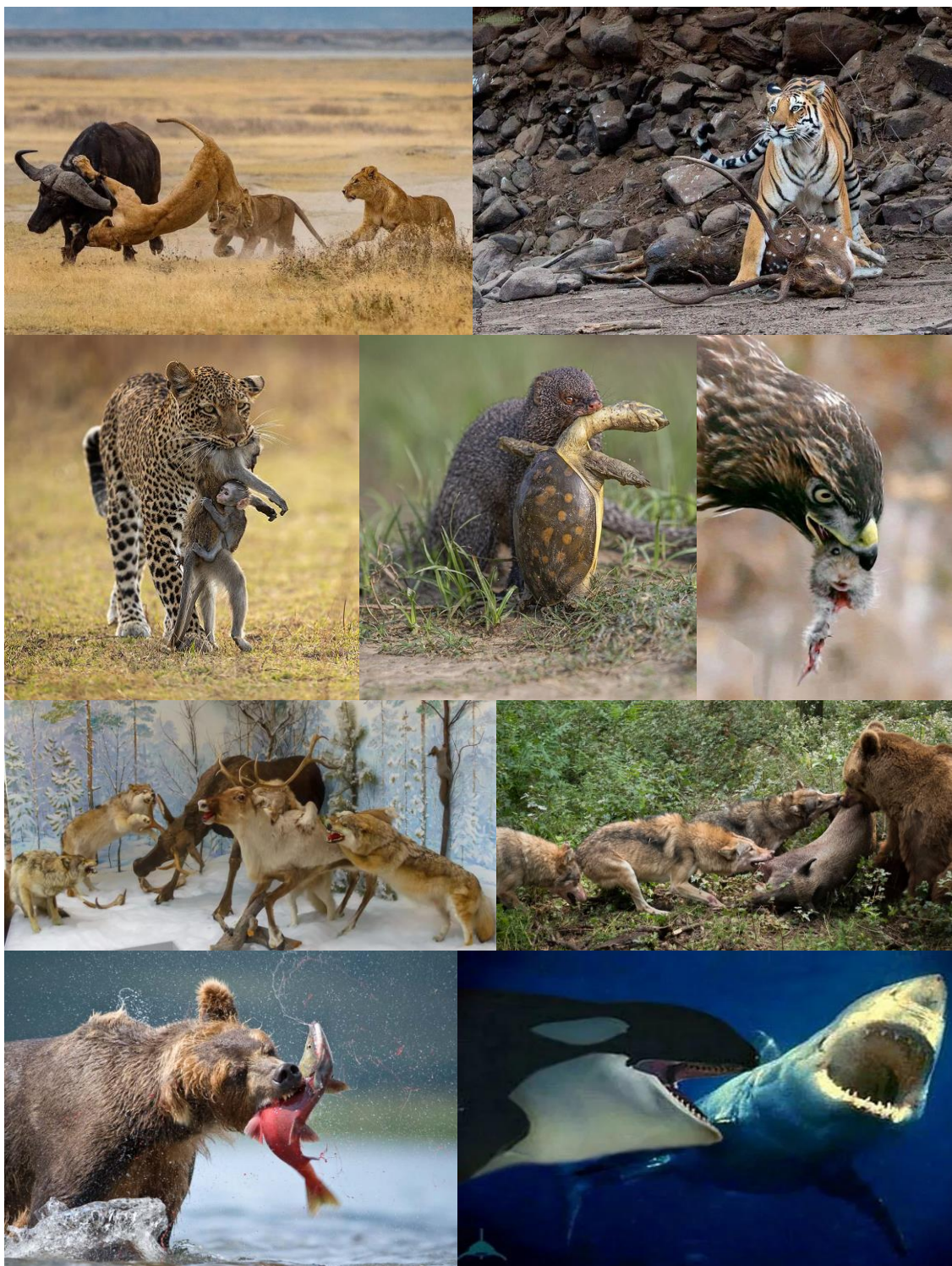
Фото слева направо и сверху вниз: 1 - охота львов на буйвола; 2 – тигр со своей жертвой – пятнистым оленем; 3 – самка леопарда умертвила самку бабуина, за которую цепко держится ее еще живой детеныш; 4 – мангуст с черепахой; 5 - ястреб с полевкой в клюве; 6 – схватка волков с оленями; 7 - дележка туши кабана медведем и волками; 8 – медведь, поедающий нерку, идущую на нерест; 9 – детеныш синего кита становится добычей касатки