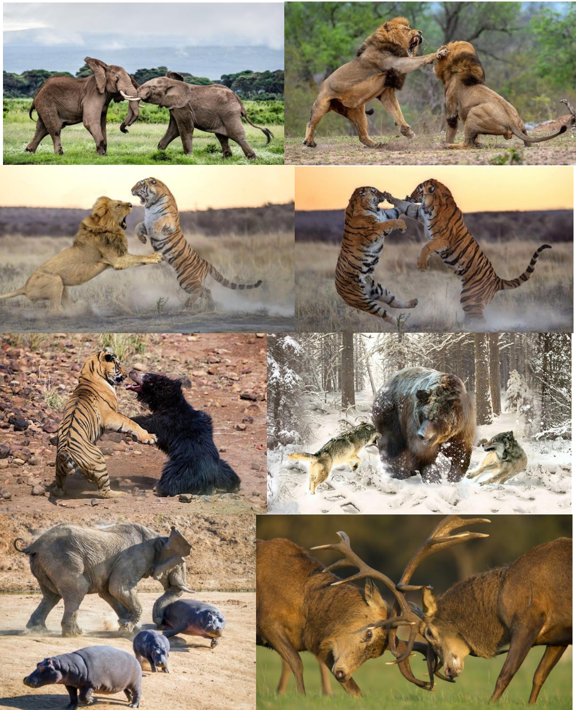
Фото слева направо и сверху вниз: 1 - схватка слонов; 2 – схватка львов; 3 – схватка льва и тигра; 4 - схватка тигров; 5 - схватка тигра и медведя-губача; 6 – схватка медведя с волками; 7 - слон против бегемотов; 8 - схватка оленей

Конкуренция – соперничество за ресурсы (форма антибиоза)