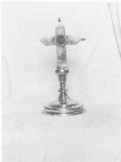
Fig. 3: Lignum crucis. San Leonardo de Yagüe.