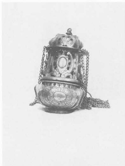
Fig. 5: Incensario. Covaleda.