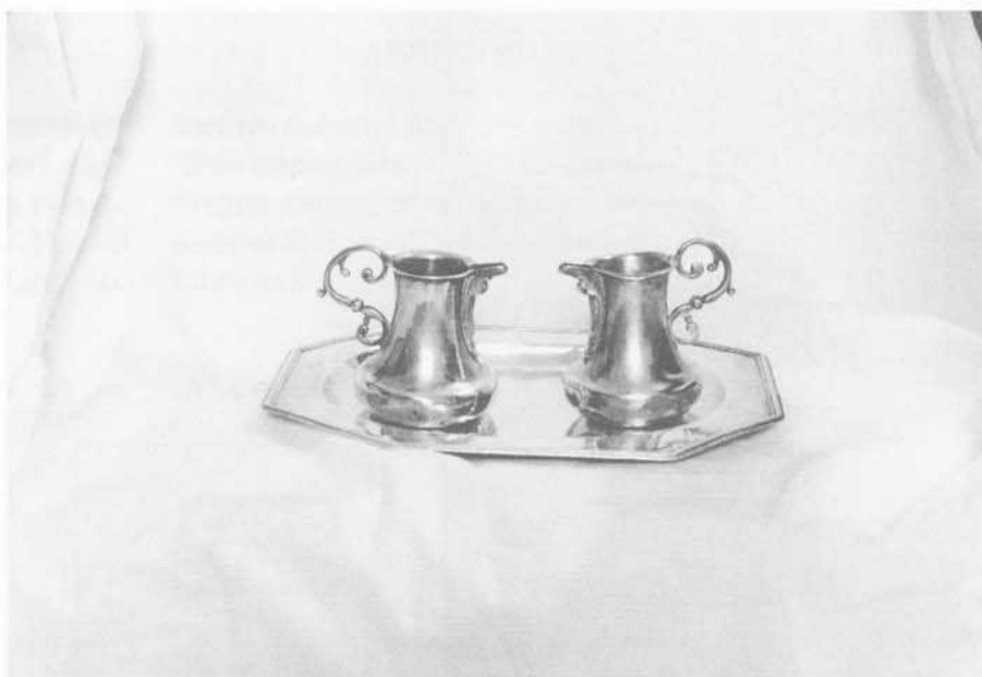
Fig. 4: Salvilla y vinajeras. San Leonardo de Yagüe.