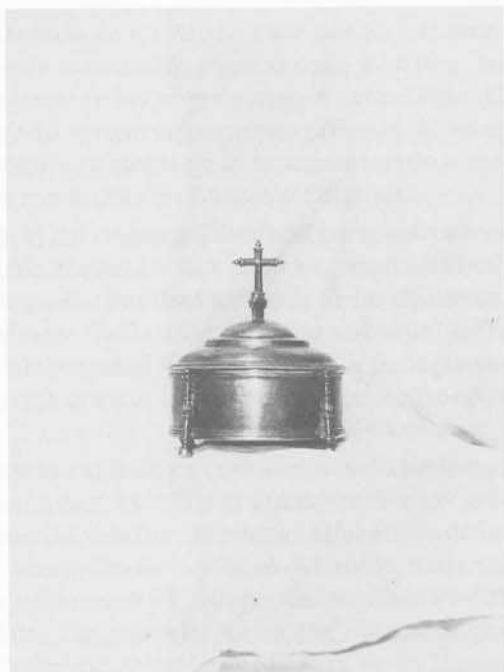
Fig. 7: Hostiario. Casarejos.