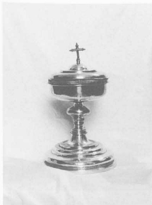
Fig. 2: Copón. San Leonardo de Yagüe.