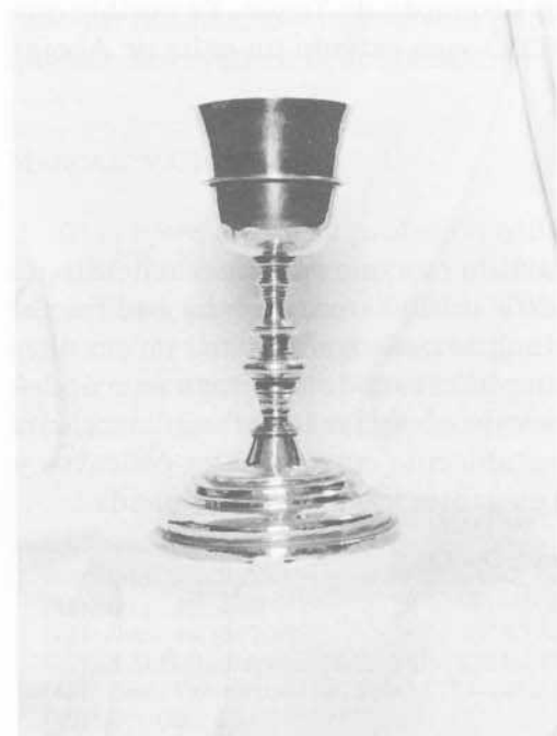
Fig. 1: Cáliz. San Leonardo de Yagüe.