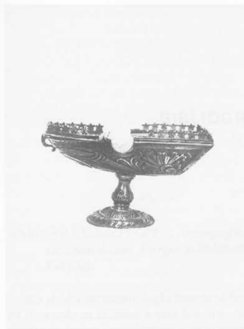
Fig. 6: Naveta. Covaleda