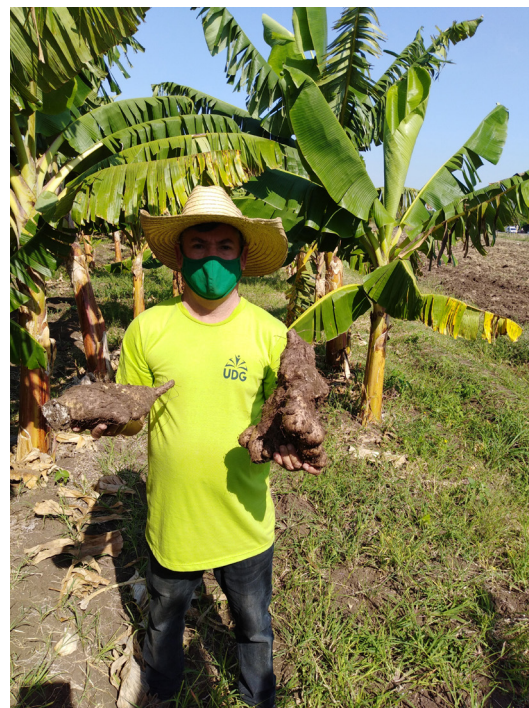
Figura 2. Tubérculos de ñame ( Dioscorea alata L.) clon Criollo procedentes de plantas obtenidas de bulbillos mayores de 80 g de masa fresca a los nueve meses de cosecha

Sin embargo, para la masa fresca de tubérculos por planta (Tabla 2, Figura 2) fue significativamente superior para la tecnología de plantación en surcos en camellón con valores de 3,2 y 3,15 para los tratamientos 2 y 3 respectivamente. Esto nos indica que la plantación en cantero es factible de uso pues asegura mejores propiedades físicas, químicas y biológicas del suelo tales como mayor humedad, disponibilidad de nutrientes y transformación de la materia orgánica por la actividad microbiana.