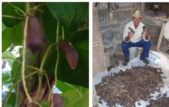
Figura 1. Bulbillos aéreos de Dioscorea alata L. clon Criollo mayores de 80 g de masa fresca colectados de plantas in vitro durante un primer ciclo de cultivo en campo (10 meses)

Se utilizaron bulbillos aéreos mayores de 80g de masa fresca de la especie Dioscorea alata L. del clon Criollo (Figura 1), colectados de un primer ciclo de cultivo en campo (10 meses) de plantas procedentes del cultivo in vitro establecidas en el banco de germoplasma del CEBVEG.