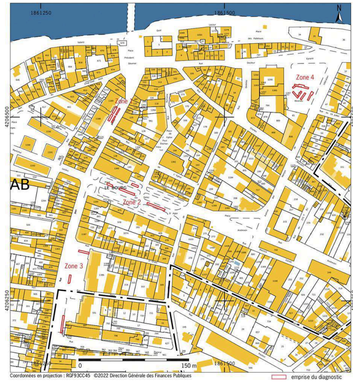
Fig. 1 – Localisation de l'opération sur fond cadastral