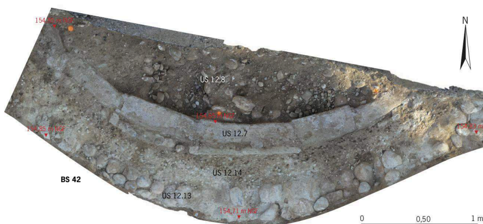
Fig. 3 – Bassin BS 42 (non vidé) dans le sondage 12

DAO : N. Attiah (Inrap).