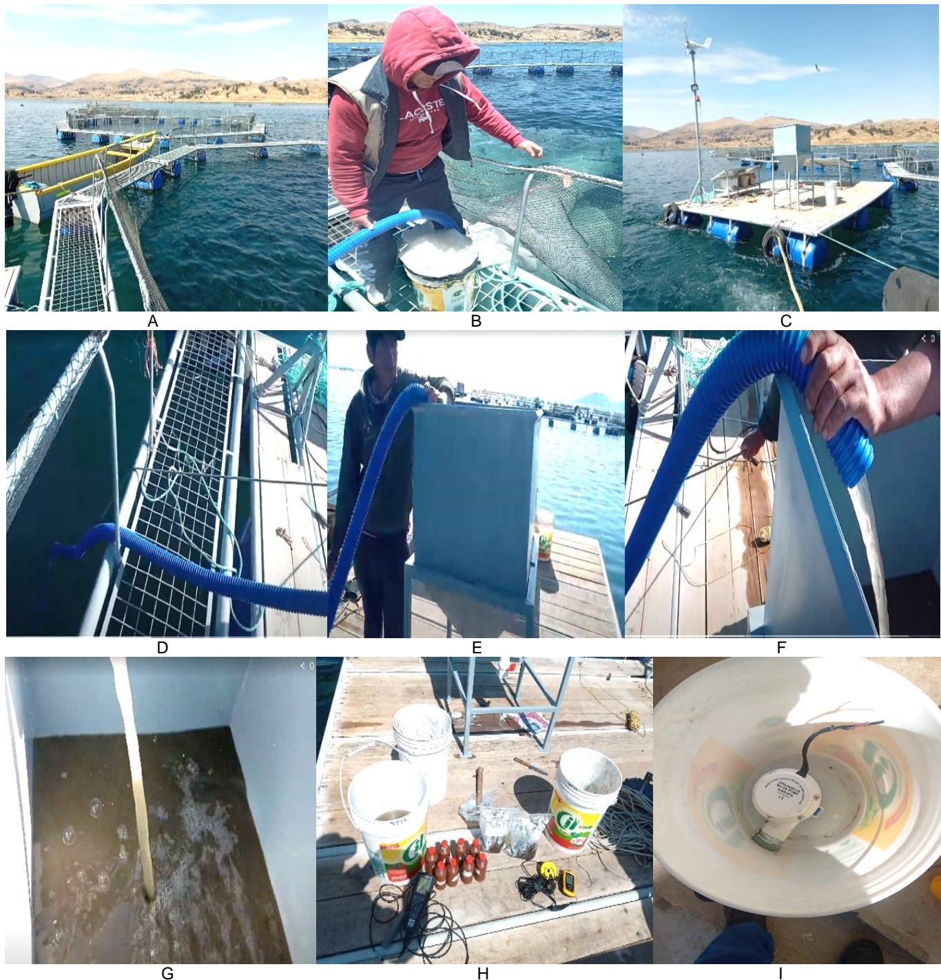
Figura 1. Instalación de jaula colector de residuos orgánicos. A) Jaula flotante de cultivo. B) Bolsa colector de 2 mm de malla. C) Plataforma flotante con energía foto voltaica y eólica. D) Manguera conectada al envase colector. E) Sedimentador vertical estático. G) Ingreso de residuos orgánicos al sedimentador. H) Residuos orgánicos en bolsa siploc y en envases. I) Envase colector con bomba sumergible de sedimento.