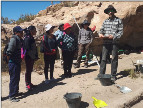
Figure 6. Excavation work.