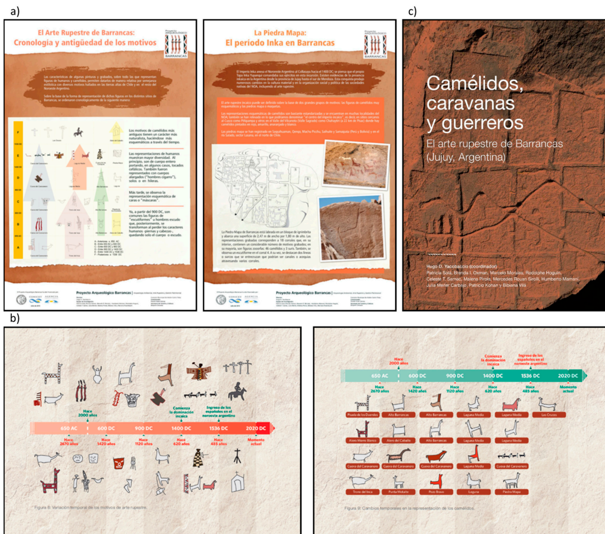
Figura 3. a) Afiches realizados por el PAB; b) Láminas informativas distribuidas en el pueblo de Barrancas sobre la arqueología del área; y c) Libro hecho para la divulgación de la arqueología del área.

Las jornadas periódicas de actualización comenzaron a implementarse en 2020 con el retorno a las actividades de campo post-pandemia del COVID-19 y para cumplir