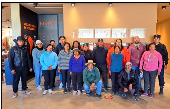
Figura 5. a) Jornadas de actualización con los distintos actores sociales de Barrancas; b) Firma del convenio vigente en la actualidad.