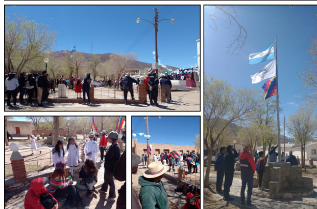
Figura 8. Aniversario del pueblo de Barrancas, celebrado el 1 de octubre de 2023