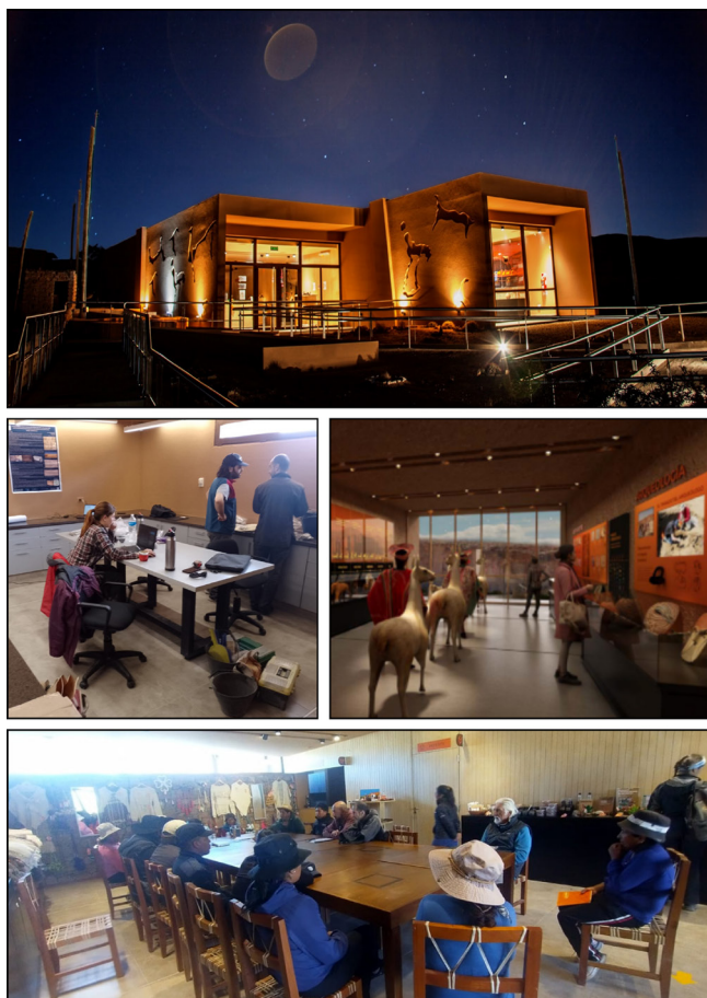
Figura 7. Centro de Interpretación Arqueológica de Barrancas.