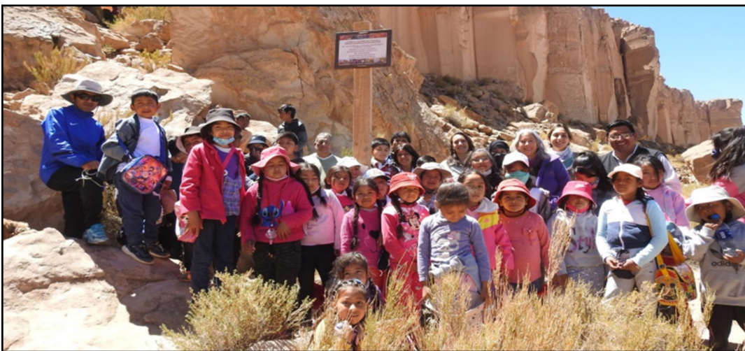
Figure 4. Working day with primary school girls and boys.

con las inquietudes de diversos habitantes de Barrancas que nos solicitaban mayor circulación de la información. Esto permitió un nuevo canal de comunicación para compartir los saberes generados por el equipo. Así, a partir de ese momento se realizaron sistemáticamente jornadas anuales de actualización y discusión en la que se comunican resultados, novedades y pasos a seguir en las excavaciones y se reciben sugerencias e intereses sobre distintos tópicos vinculados a la actividad arqueológica (Figura 5.a).