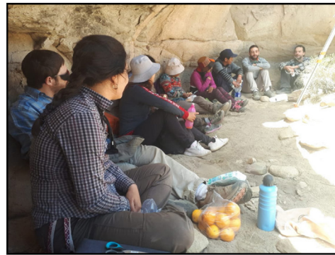
Figura 6. Talleres de excavación.