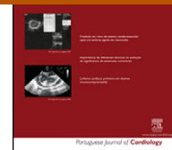
IMAGEM EM CARDIOLOGIA